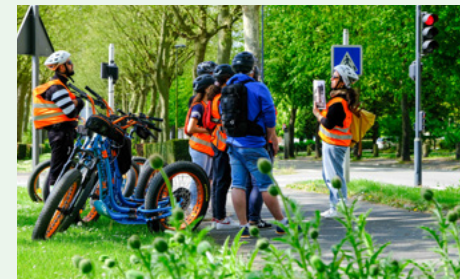
Vitesse de croisière à travers les jardins

Réservation indispensable au 03 27 78 36 15.