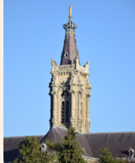
Le clocher de la cathédrale Marque le paysage cambrésien