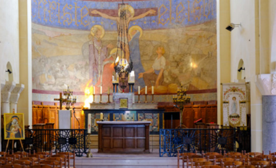
L'Art déco dans les édifices religieux L'église de Flesquières

Jusqu'au 26 avril aux heures d'ouverture du Cambrai Tank 1917