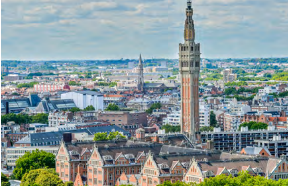
Le beffroi de l'hôtel de Ville