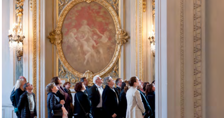
Visite à l'Opéra de Lille