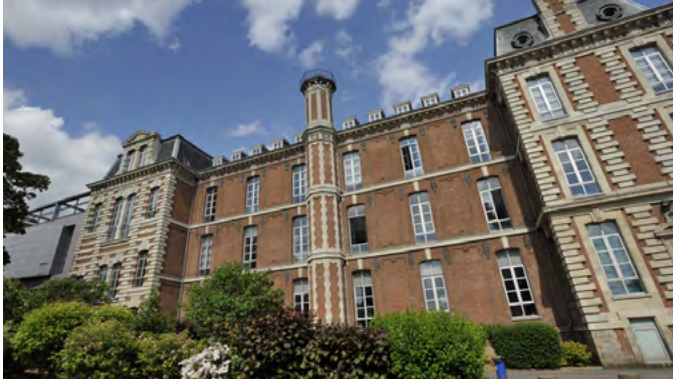
Lycée Montebello