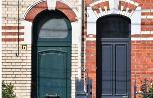
Rue Marengo