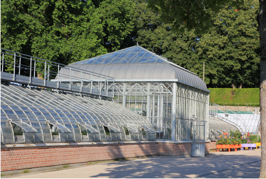
La serre Napoléon III