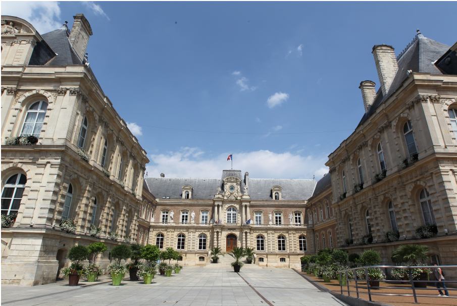
Cour d'honneur