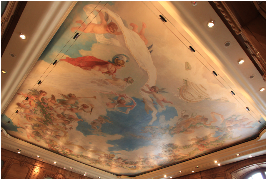
Plafond de la salle des mariages présentant une fresque peinte en 1907 par Louis Dumoulin figurant les mariés se donnant des airs de héros antiques.