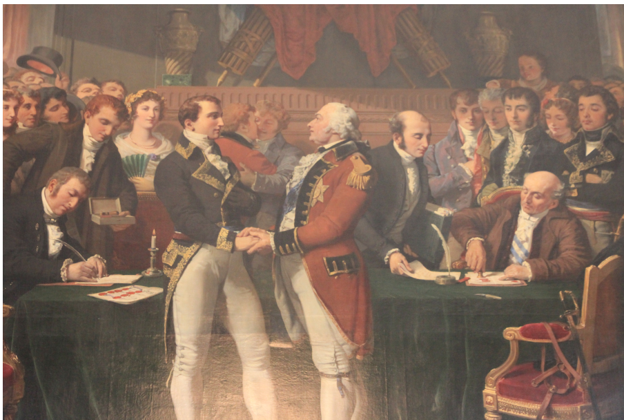
Détail du tableau de Claude-Jules Ziegler dans la Salle du Congrès représentant la Paix d'Amiens.