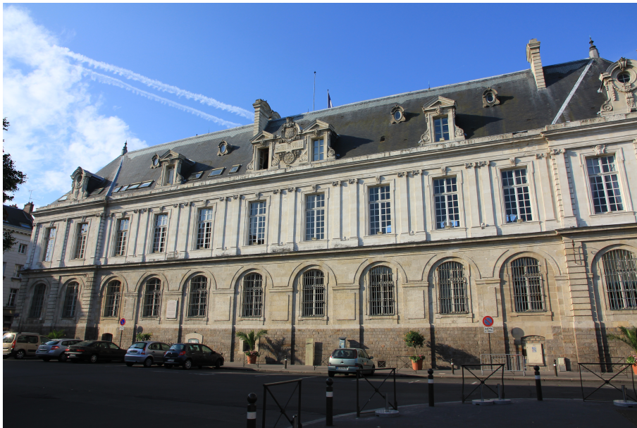
Façade arrière