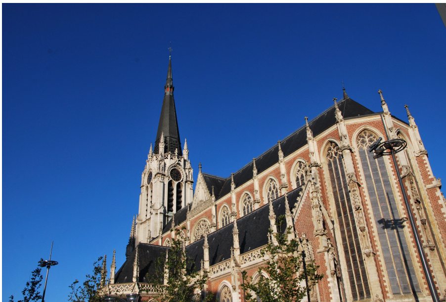
Vue extérieure du chœur