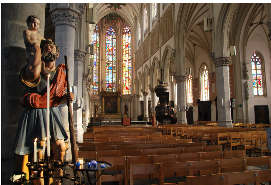
Vue intérieure de l'église