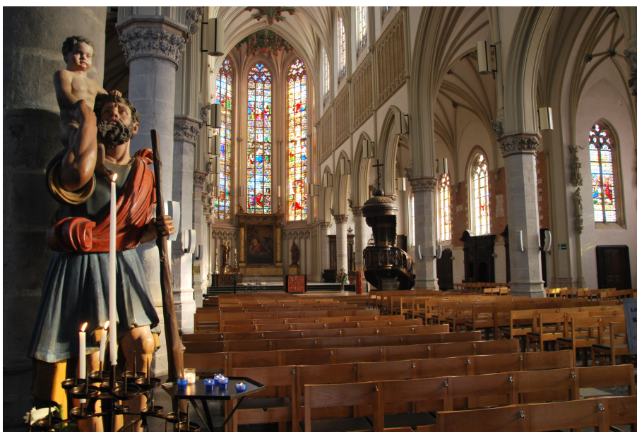
Vue intérieure de l'église