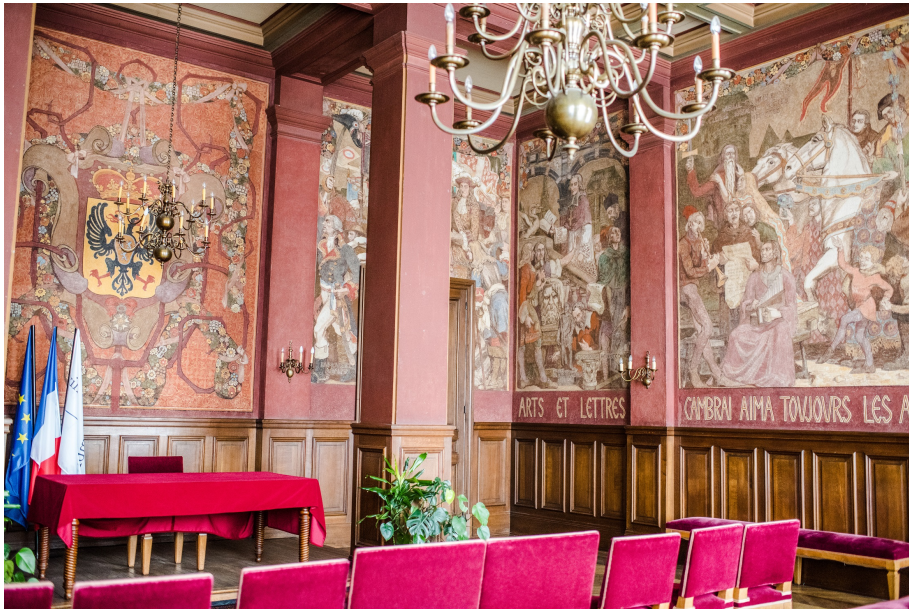
La salle des mariages avec la fresque d'Emile Flamant de 1931