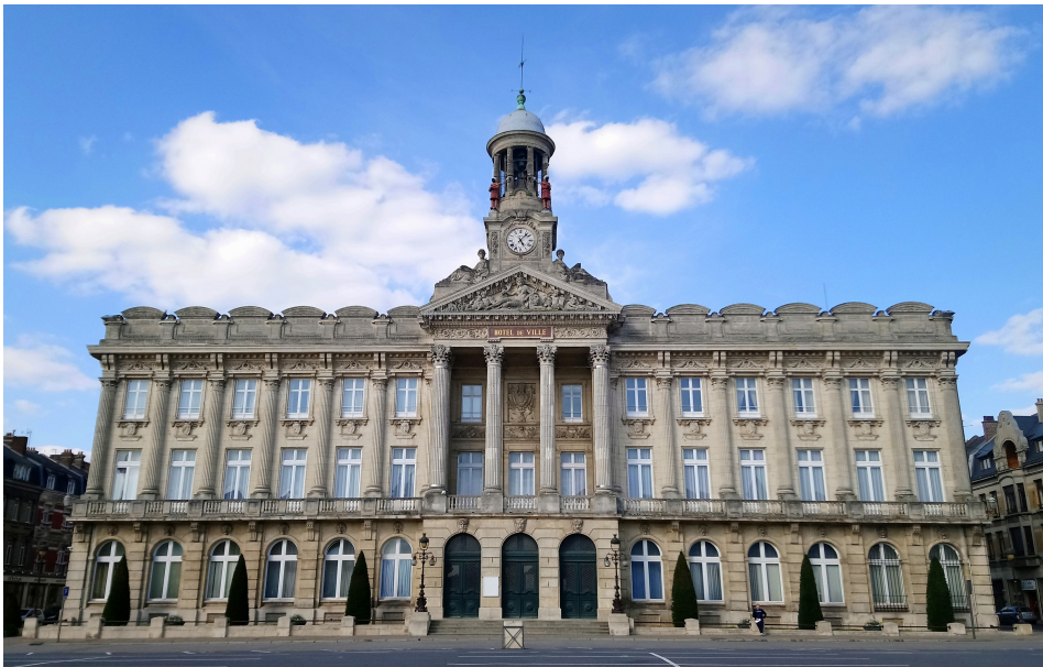
La façade de l'hôtel de ville

L'hôtel de ville de Cambrai est plus qu'un centre administratif pour les habitants, par son architecture et son emplacement au cœur de Cambrai.