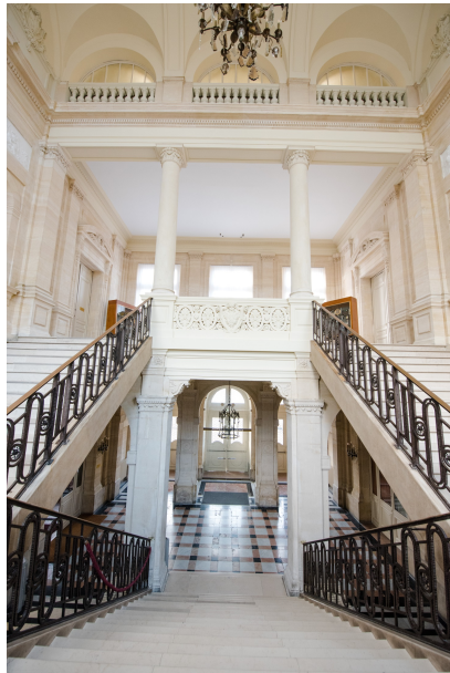
L'escalier d'honneur de l'hôtel de ville