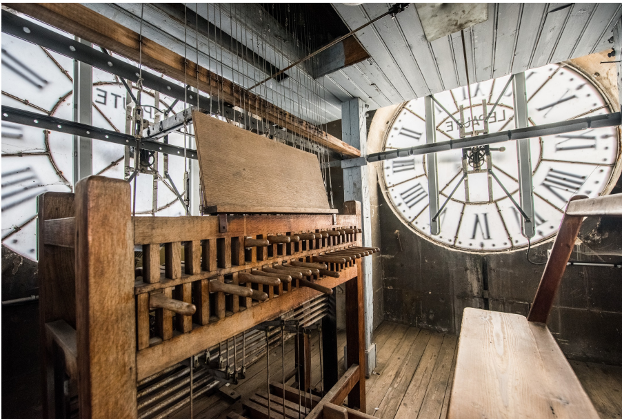
Le carillon de l'hôtel de ville