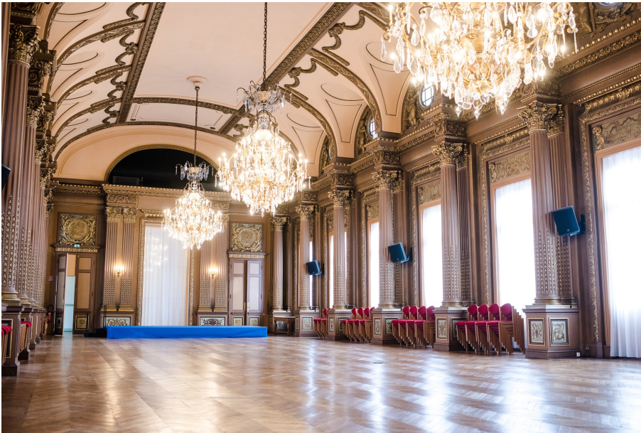
La salle des fêtes de l'hôtel de ville