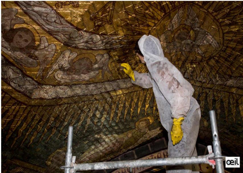
Roubaix St-Joseph Ville de Roubaix