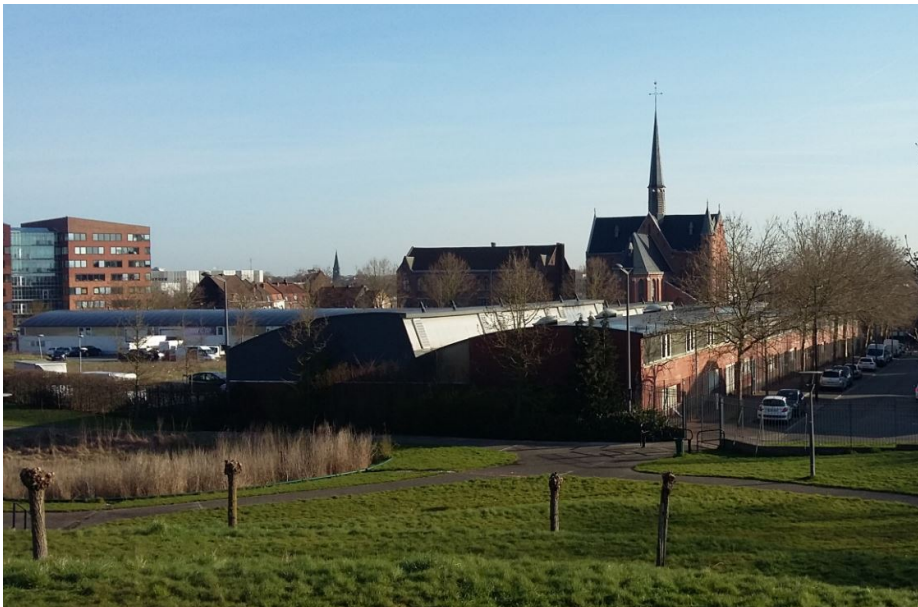
Roubaix St-Joseph Ville de Roubaix