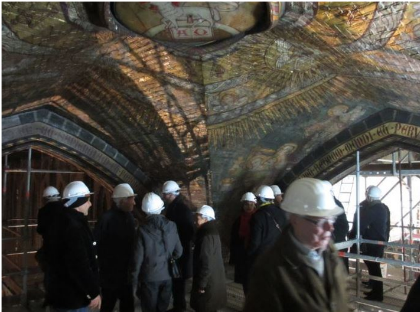
Roubaix St-Joseph Ville de Roubaix