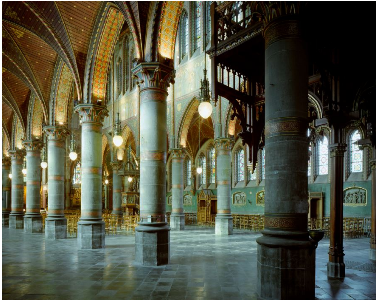
Roubaix St-Joseph Ville de Roubaix

Édifiée dans les années 1870 dans un quartier en pleine extension, l'église Saint-Joseph surprend par le contraste entre l'extrême sobriété de ses façades extérieures et la profusion de son décor intérieur, chef-d'œuvre de l'architecture néo-gothique.