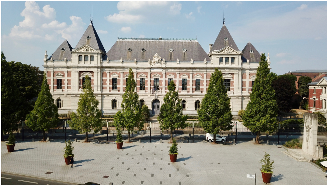
ENSAIT Façade