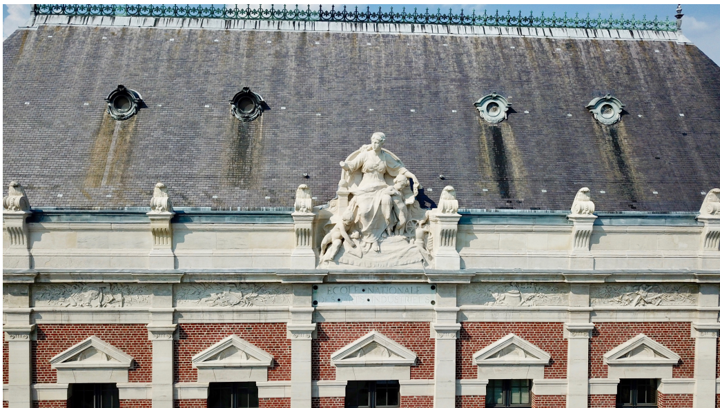
ENSAIT Détail