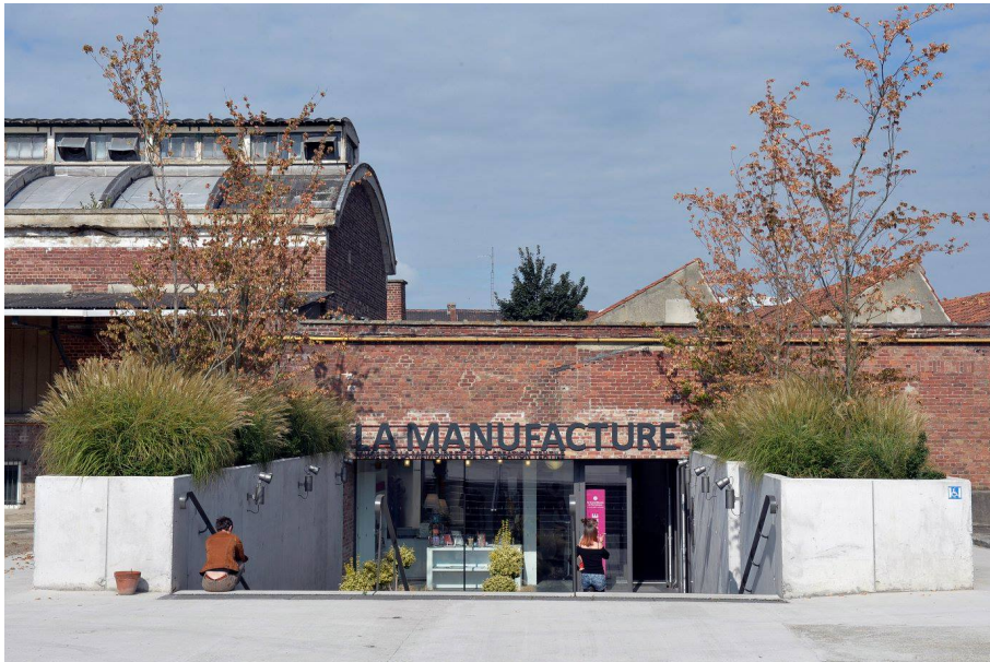
Roubaix La Manufacture

La Manufacture, musée de la mémoire et de la création textile, permet de porter un regard concret sur le patrimoine textile grâce à son exceptionnelle collection de métiers à tisser. Sa vocation est aussi de présenter l'actualité du textile grâce à la création contemporaine.