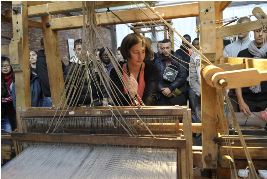
Roubaix La Manufacture