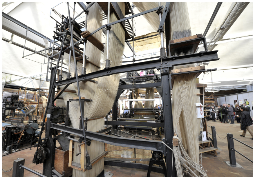
Roubaix La Manufacture