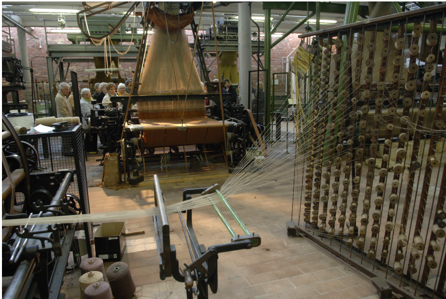
Roubaix La Manufacture