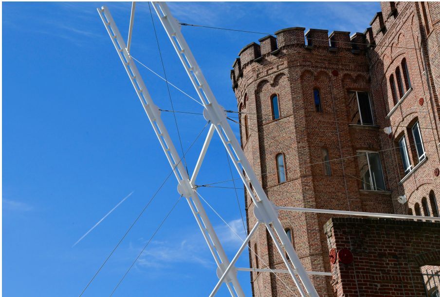
Motte Bossut