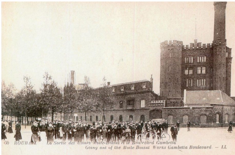
Motte Bossut