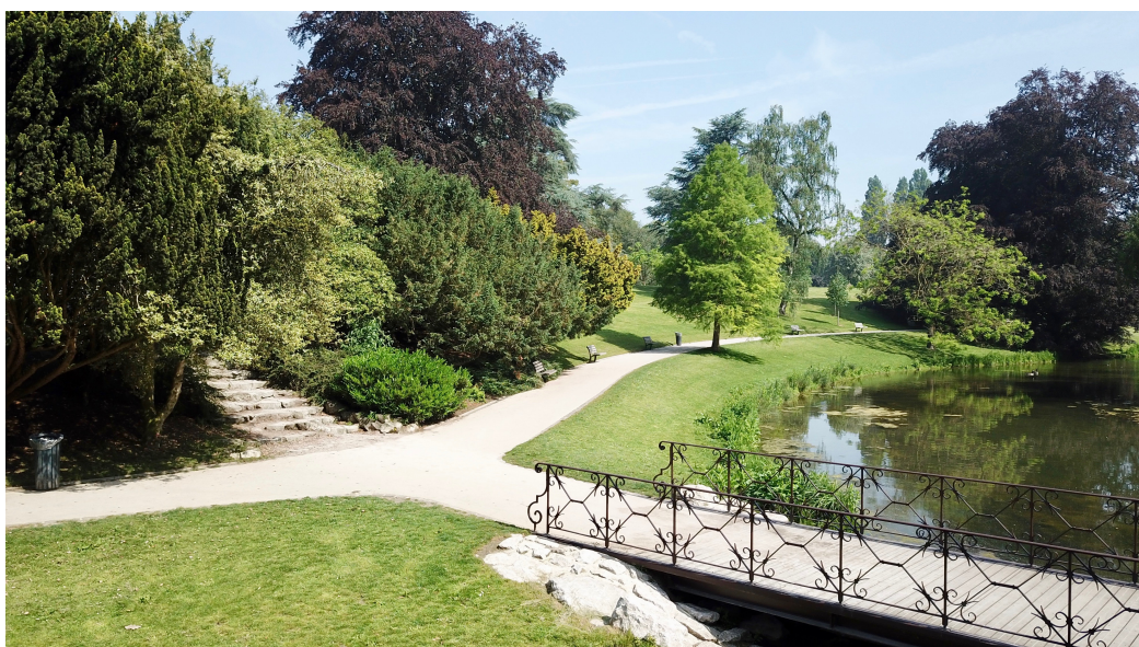
Parc de Barbieux