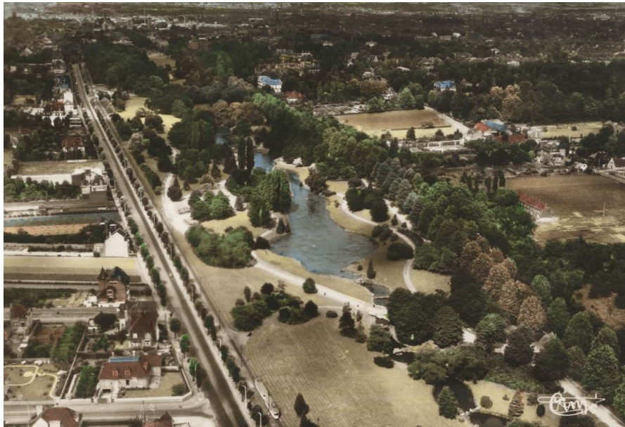
Parc de Barbieux, vue aerienne, carte postale, vers 1950