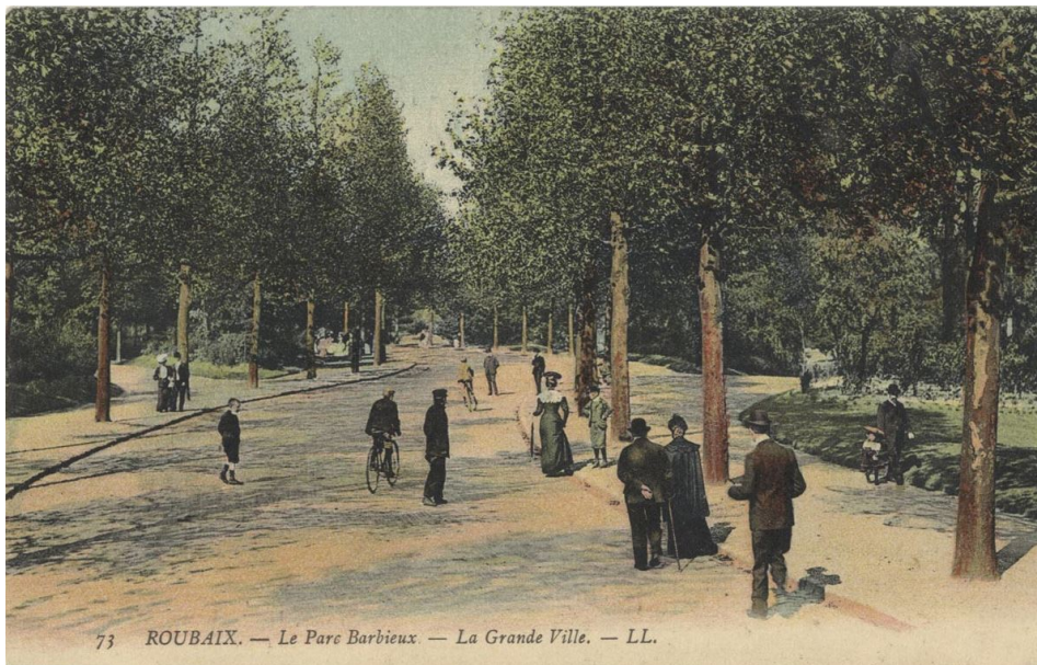
Parc Barbieux carte postale