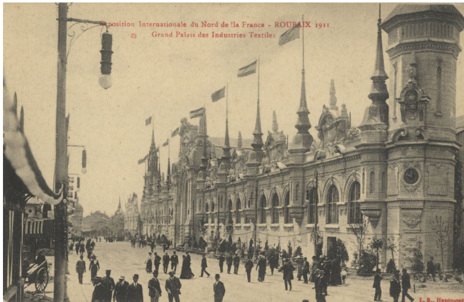
Parc de Barbieux, l'Exposition internationale de 1911