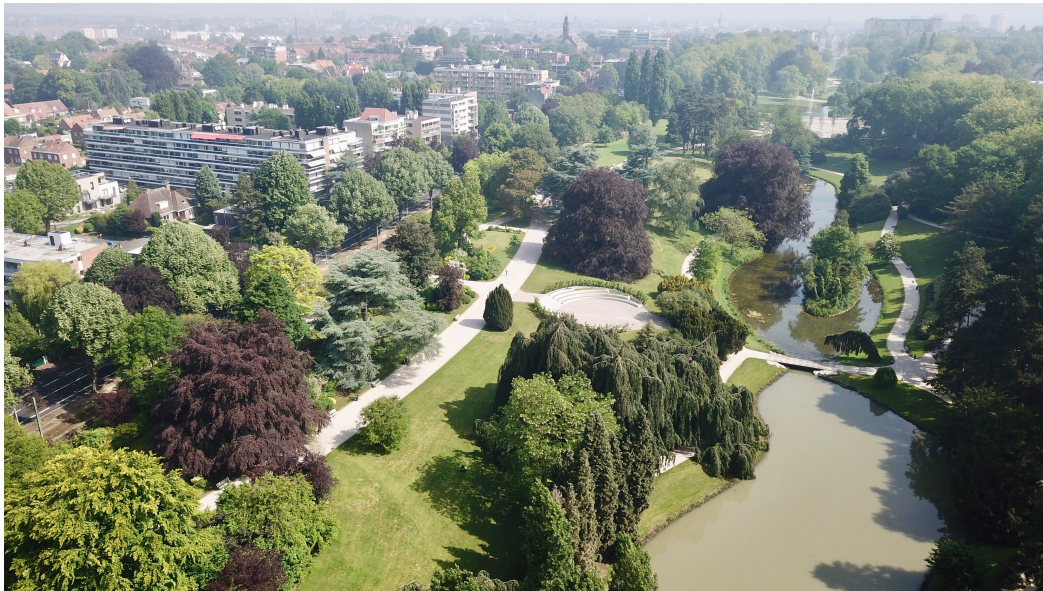
Parc de Barbieux