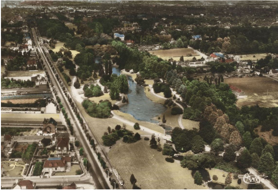
Parc de Barbieux, vue aerienne, carte postale, vers 1950