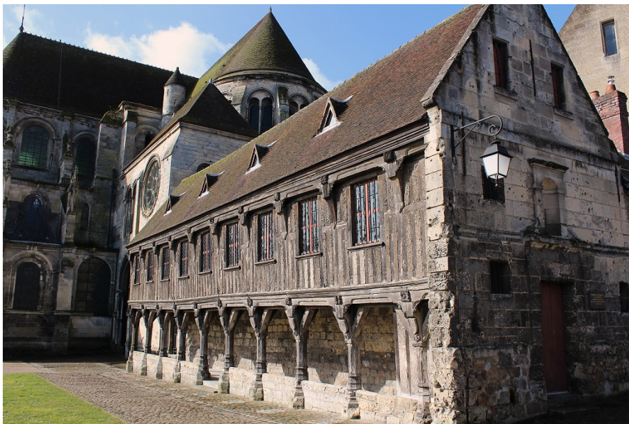
La bibliothèque du Chapitre

Établie au cœur du quartier cathédral, la bibliothèque du Chapitre est élevée en 1506 par les chanoines désireux d'y conserver leurs précieux ouvrages. Elle est aujourd'hui un rare témoignage en Europe de bibliothèque à pans de bois.