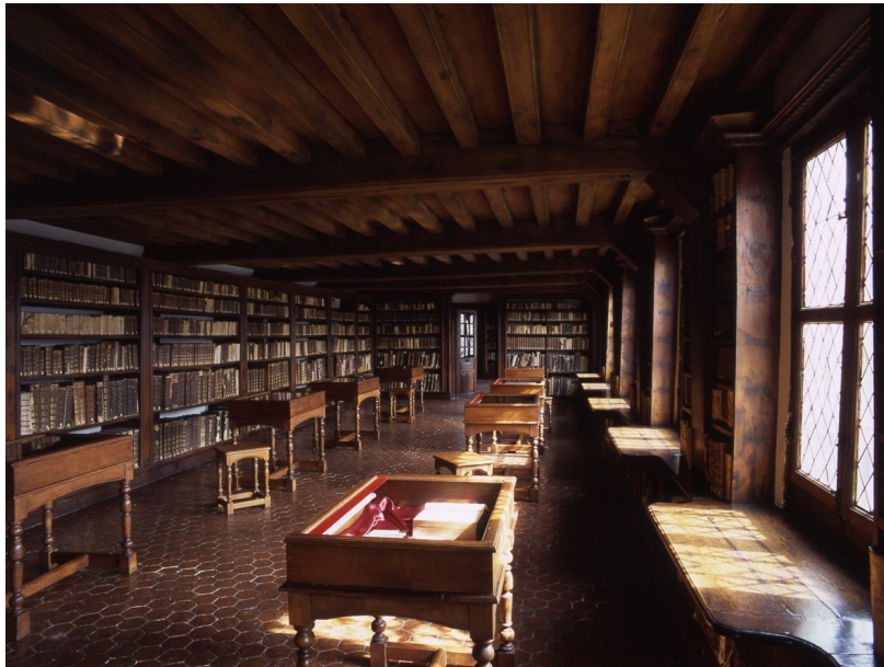
L'intérieur de la bibliothèque