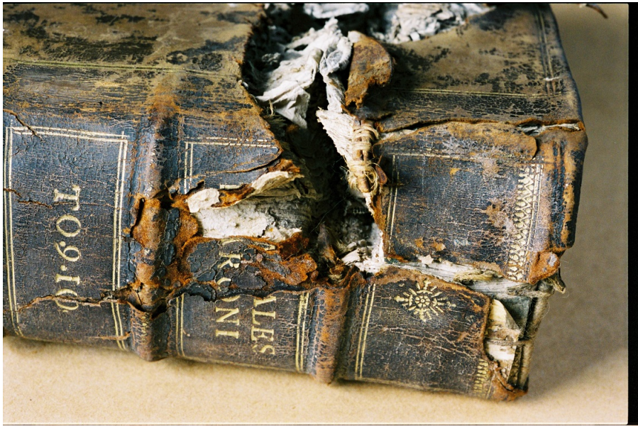
Des éclats d'obus