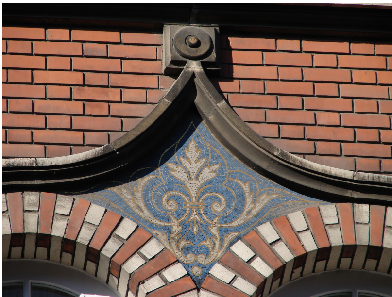
Détail mosaïque