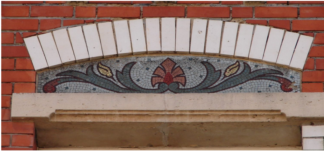
Décor mosaïque et briques vernissées