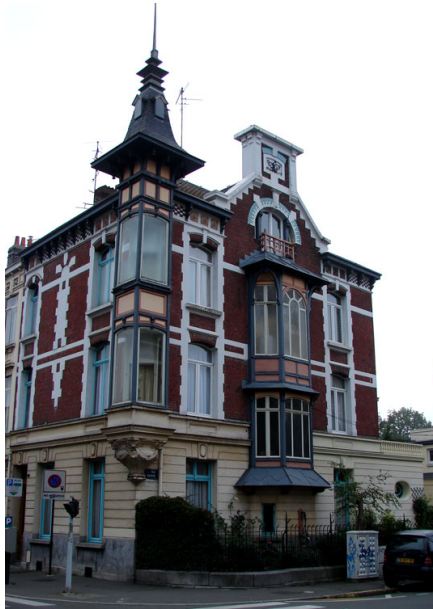
Pavillon à l'angle de la rue Gounod