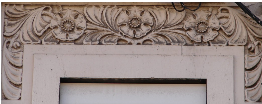
Détail sculpté