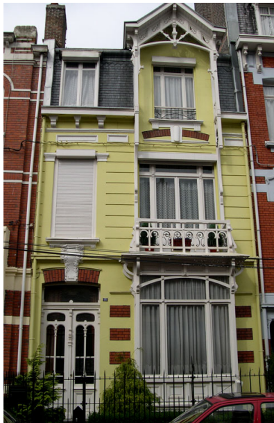
Maison rue Gounod 1