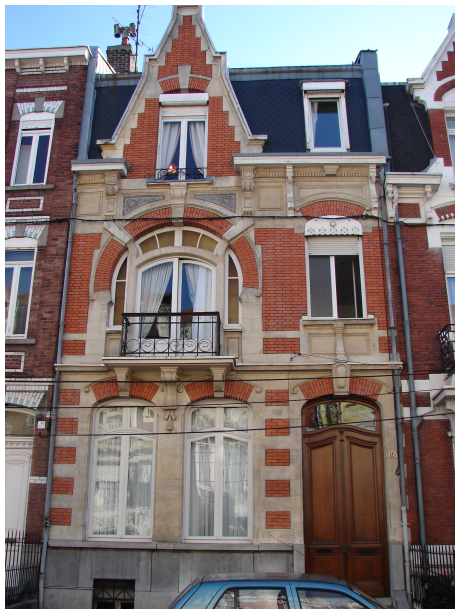
Maison rue Gounod 2