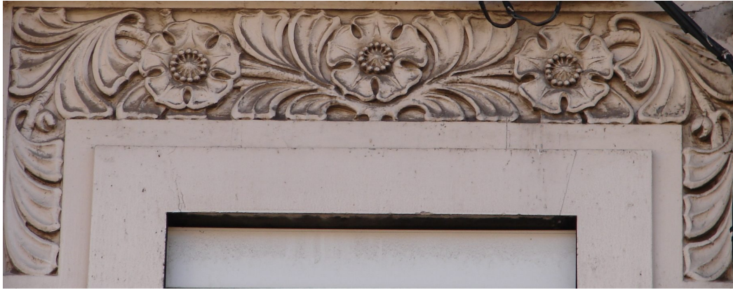
Détail sculpté © SVAH Lille