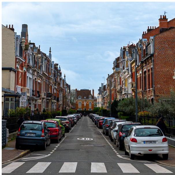
Rue Gounod