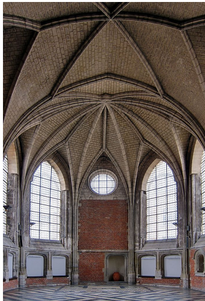
Salle du Conclave