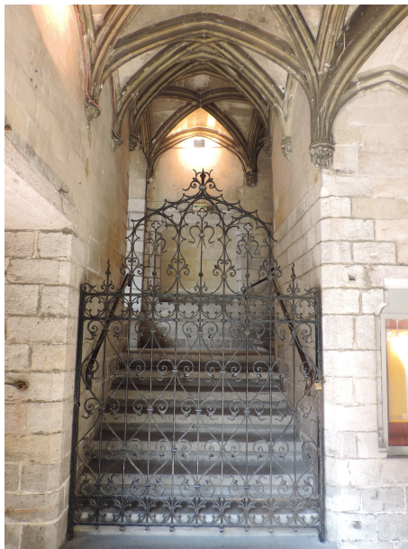
Escalier vers salle du Conclave