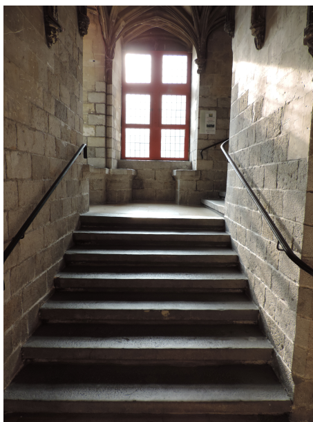
Escalier vers salle du Conclave bis