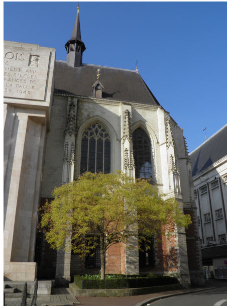
Vue de la Chapelle – extérieur