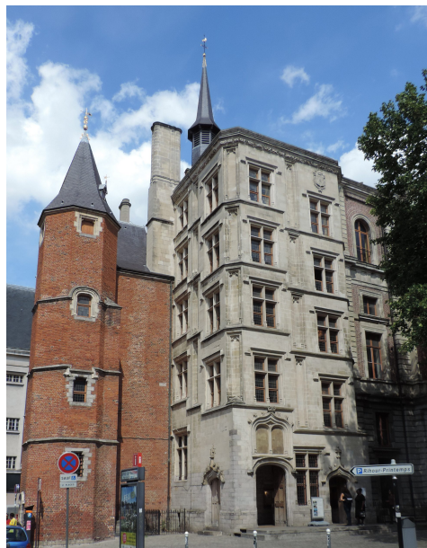
Palais Rihour actuellement

Le Palais Rihour, construit au 15e siècle, est né de la volonté des ducs de Bourgogne de disposer d'une somptueuse demeure près de la place du marché. Il devient hôtel de ville dès 1664. L'édifice, plusieurs fois incendié et transformé entre le 16e et le 19e siècle est de nouveau détruit en 1916 par un incendie accidentel. Seule subsiste la partie du 15e siècle. Le palais abrite aujourd'hui l'office de tourisme au rez-de-chaussée, l'étage servant pour diverses manifestations municipales.