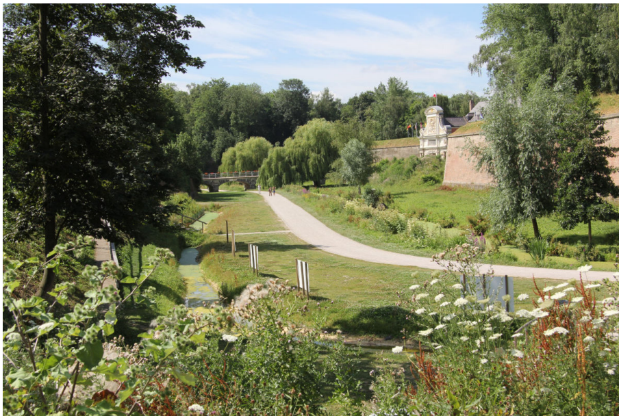
Vue de la contre garde vers la Porte Royale

La construction de la Citadelle ouvre une période nouvelle pour Lille. Intégrée au royaume de France en 1667, la ville est agrandie et se pare progressivement d'architectures à la française. La création de la Citadelle affirme ainsi la volonté de Louis XIV de placer définitivement Lille sous sa tutelle. Elaboré en plusieurs étapes, l'ouvrage militaire apparaît comme une œuvre majeure du grand ingénieur Vauban.