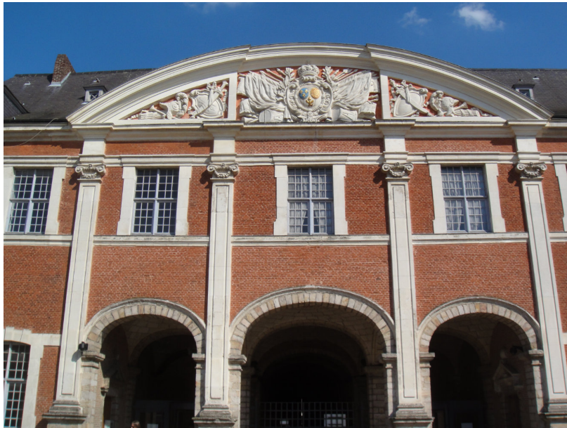
La porte Royale vue intérieure