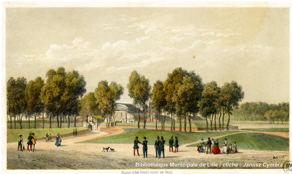
Vue de la Citadelle