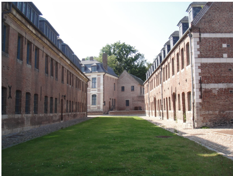
Vue intérieure de la Citadelle