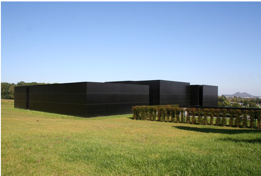
Centre d'histoire Mémoires 14-18 Notre-Dame-de-Lorette