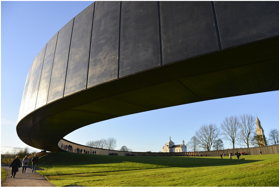
Anneau de la Mémoire