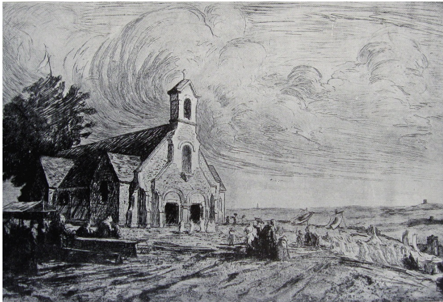
Ancienne chapelle Notre-Dame-de-Lorette par Arthur Mayeur