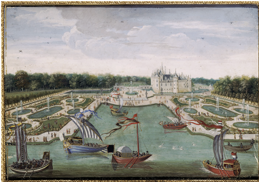
Vue du château et des parterres depuis le vertugadin, anonyme © musée Condé, Chantilly