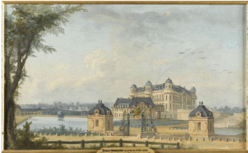
Le château de Chantilly vu de la Pelouse, 18e siècle