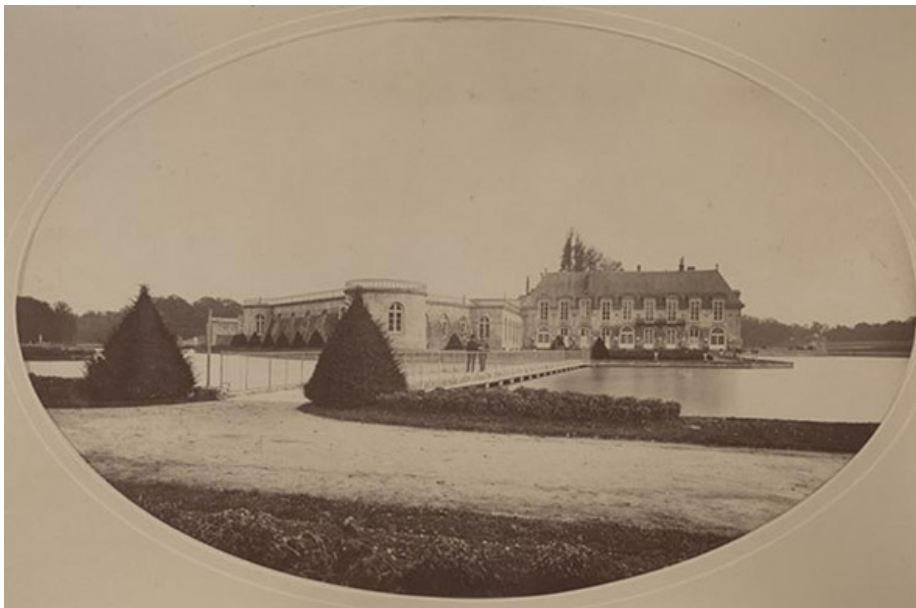
Photographie Le château de Chantilly et le pont de la Volière, avant la reconstruction du grand château, Claudius Couton, 1872 © musée Condé, Chantilly