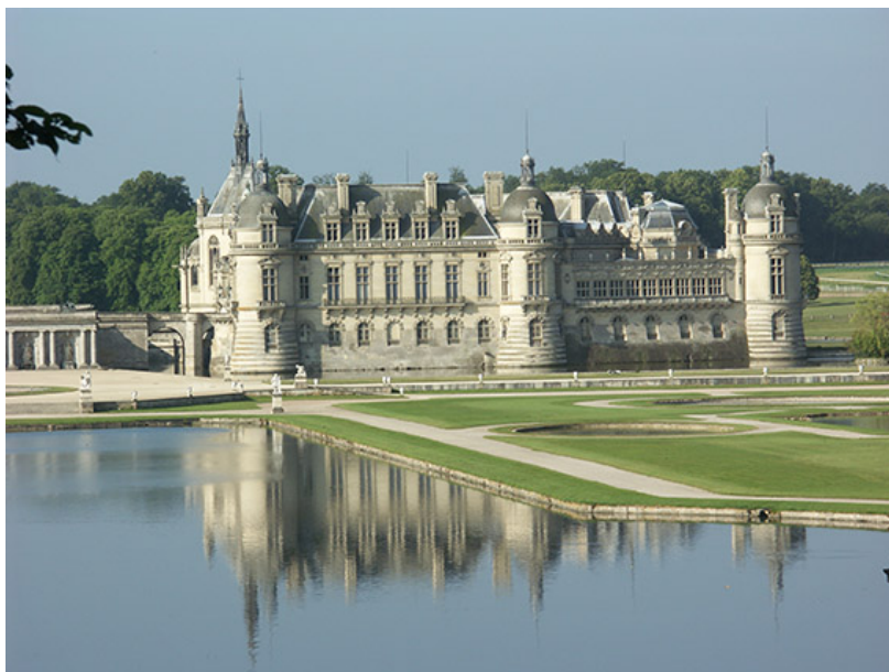
Château de Chantilly

Niché au cœur d'un domaine de plus de 7 000 hectares, le château de Chantilly est depuis la fin du 19e siècle propriété de l'Institut de France. Mais de nombreux propriétaires se sont succédé depuis le 11e siècle et ont façonné ce château suivant leurs goûts et leurs besoins.