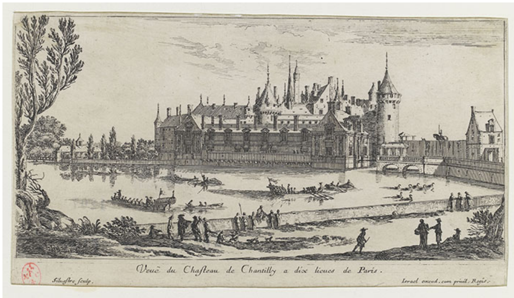
Gravure d'Israël Silvestre Veüe du Chasteau de Chantilly à dix lieux de Paris