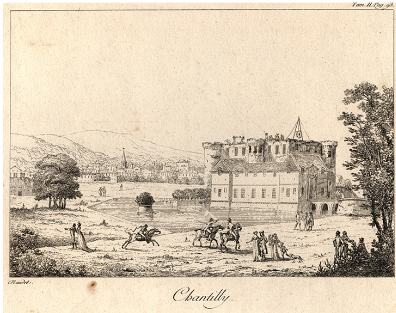
Démolition du château de Chantilly, gravure de Thomas Naudet, 1799,1803