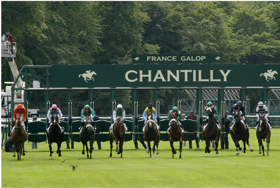
Boites de départ à l'hippodrome de Chantilly