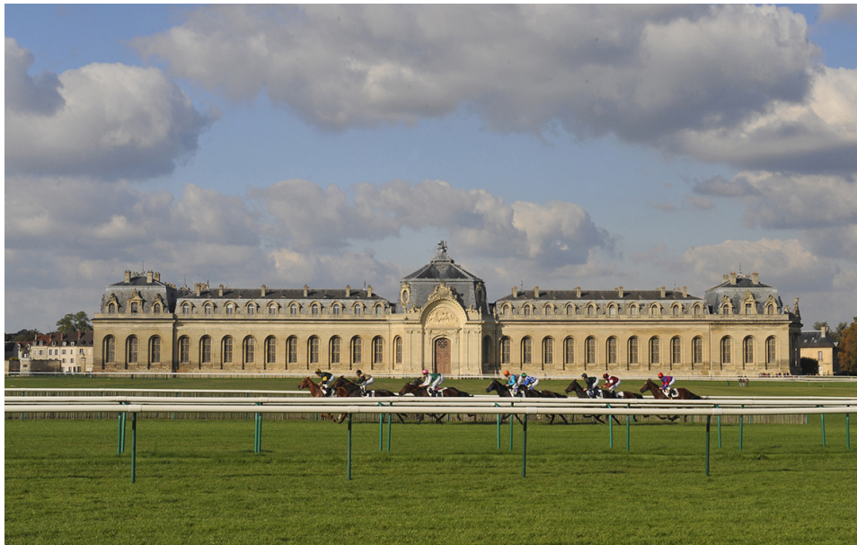
Les grandes écuries et l'hippodrome de Chantilly