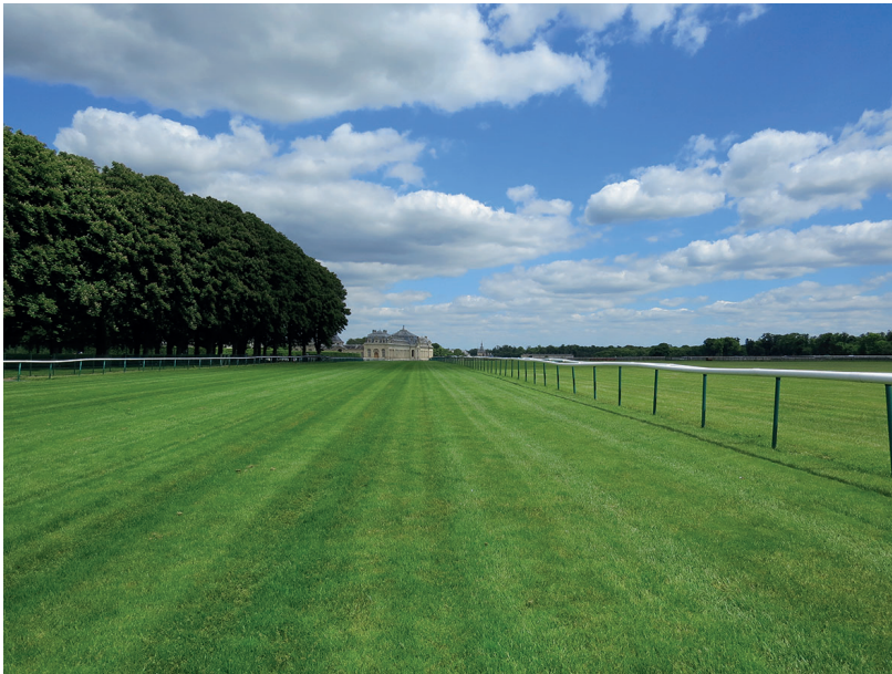
Les pistes en gazon de l'hippodrome