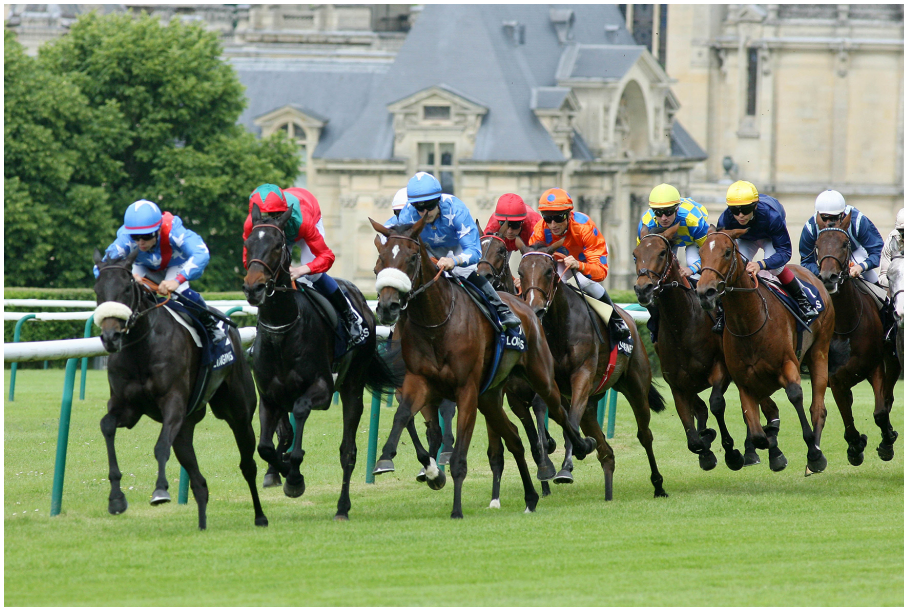
Courses à l'hippodrome de Chantilly