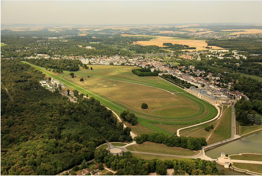
Vue aérienne de l'hippodrome