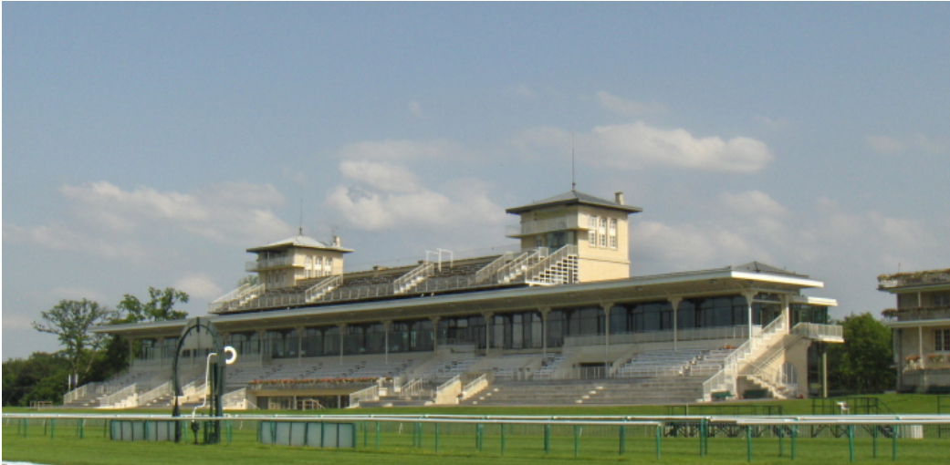
Les grandes tribunes de l'hippodrome