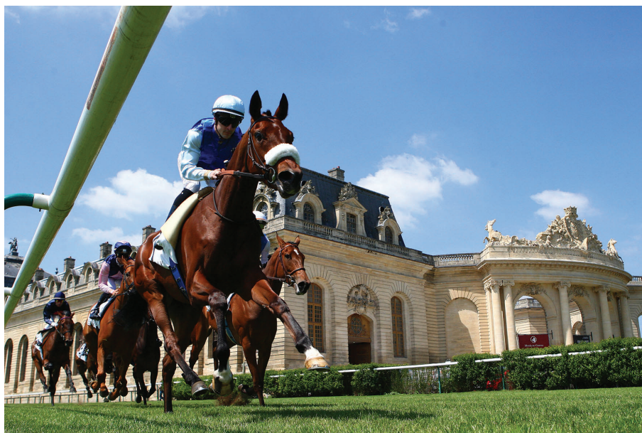
Le virage des grandes écuries à l'hippodrome de Chantilly

L'hippodrome de Chantilly est à la fois un des fleurons de son patrimoine et le poumon économique de la ville. Créé en 1834, il accueille chaque année deux des plus grandes courses de galop et assure la renommée de la ville à travers le monde.