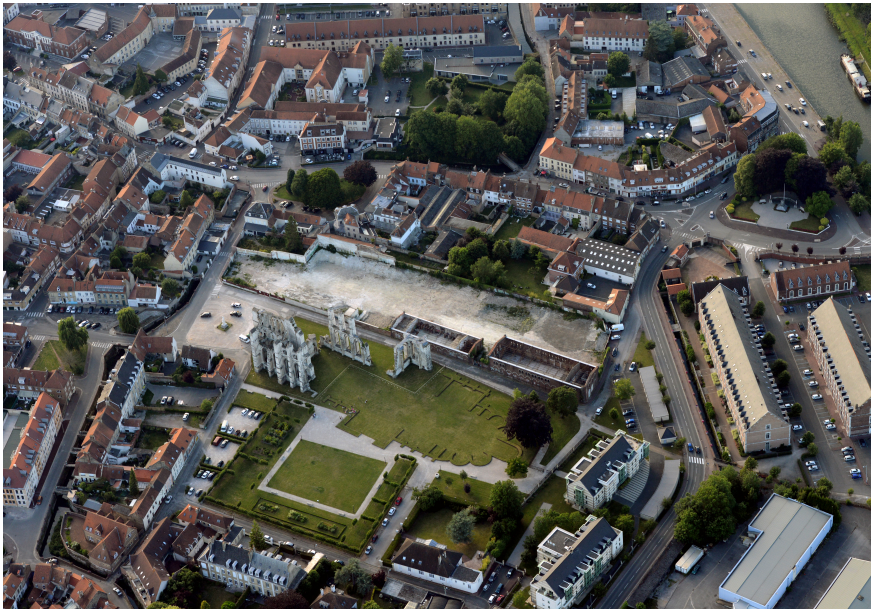
Le parc des ruines de l'abbaye