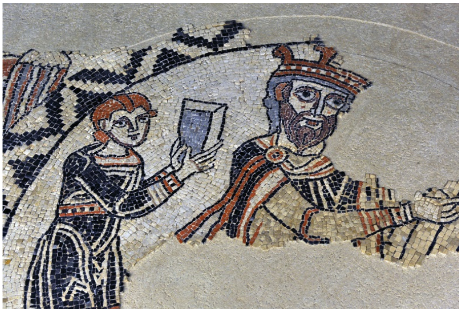
Le roi David jouant de la harpe mosaïque de pavement romane