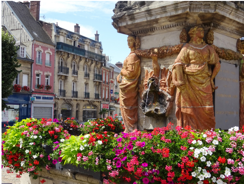
Vertus de la fontaine du Dauphin