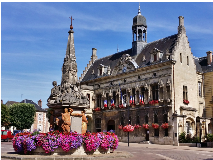
La fontaine du Dauphin et l'hôtel de ville

La fontaine du Dauphin, datée du 18e siècle, commémore le mariage en 1770 du Dauphin Louis, futur Louis XVI et de Marie-Antoinette par un décor riche et chargé en symboles.