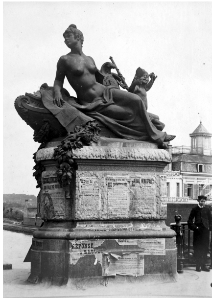
Une des 4 sculptures du pont avant sa reconstruction