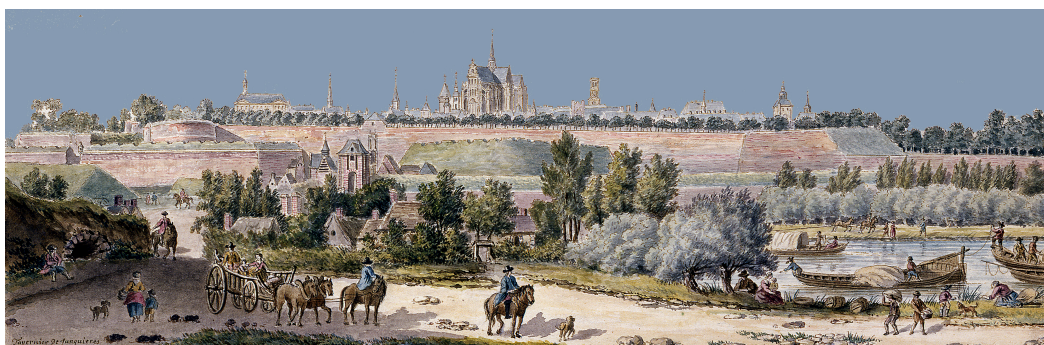
Dessin de la ville au 17e siècle représentant premier pont au-dessus des marais

Pour franchir le canal séparant le centre de la ville et le faubourg d'Isle, un pont est inauguré en 1907, orné de quatre groupes sculptés en bronze réalisés par Corneille Theunissen (1863-1918), auteur, dix ans plus tôt, du monument de 1557 aujourd'hui situé sur la Place du Huit-Octobre.