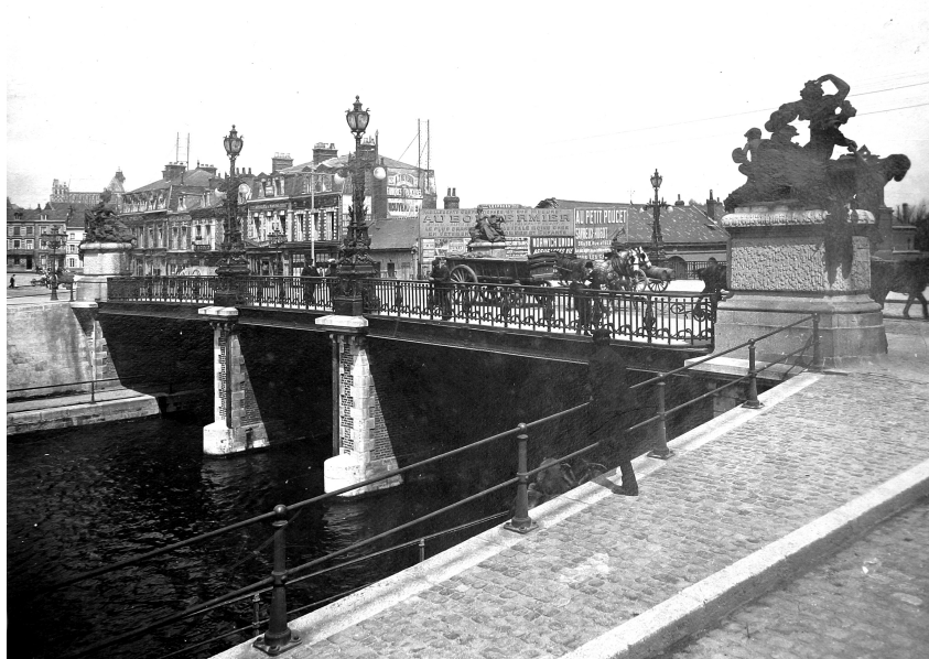
Le pont d'Isle au début du 20e siècle