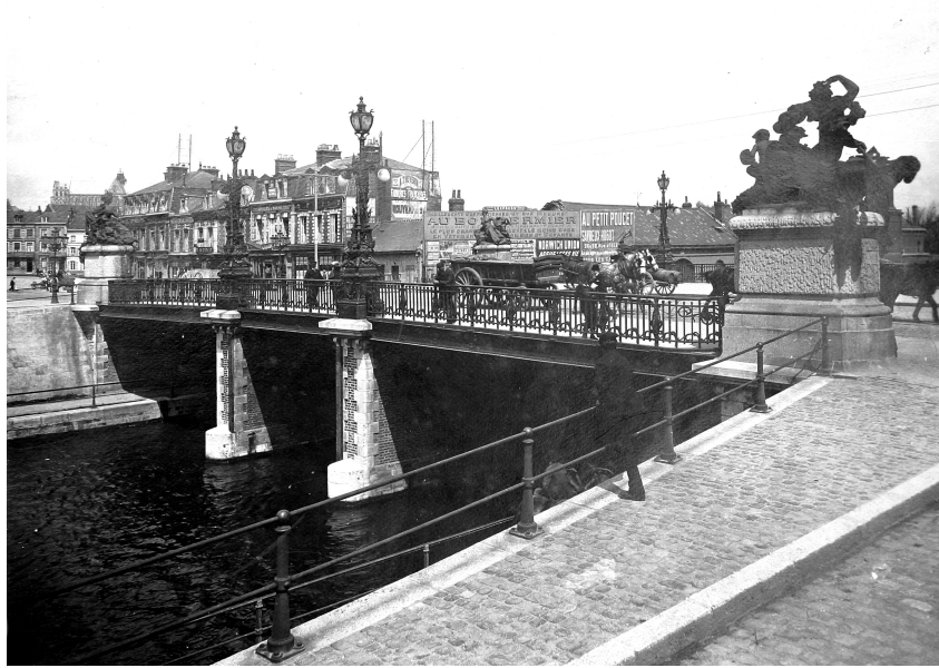
Le pont d'Isle au début du 20e siècle