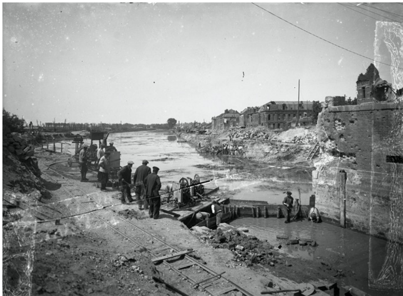
Vue du port depuis le pont d'Isle