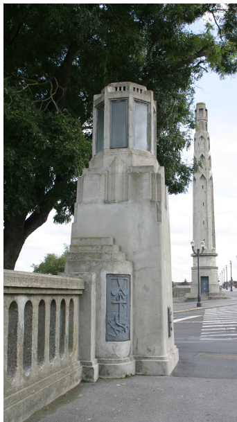
Vue d'une des quatre tours