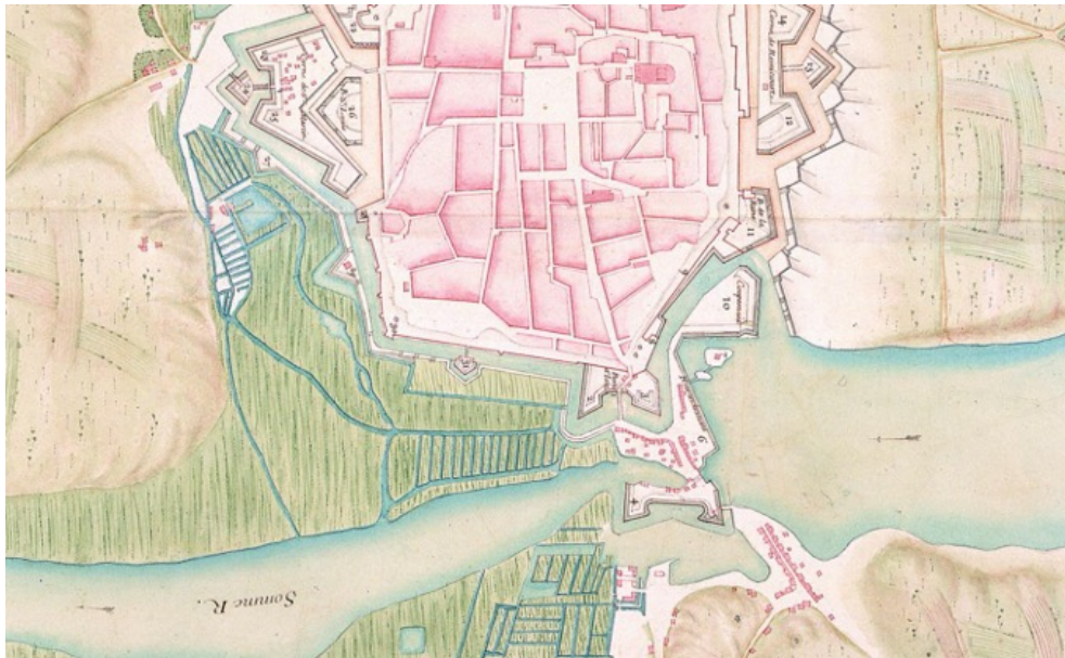
Plan de Saint-Quentin en 1693