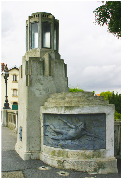
Vue de la tour de L'Escaut