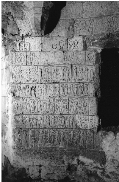
Frise gravée dans le château de Selles