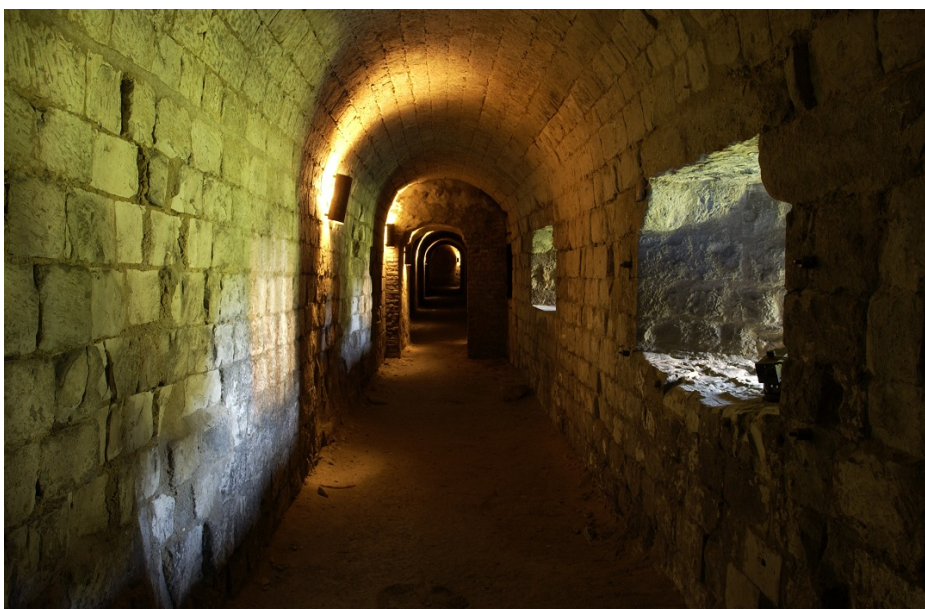
Dans une gaine du château de Selles

Le château de Selles est aujourd'hui difficilement visible depuis les rues de Cambrai. Construit au 13e siècle, seule sa partie souterraine est conservée depuis le 16e siècle.