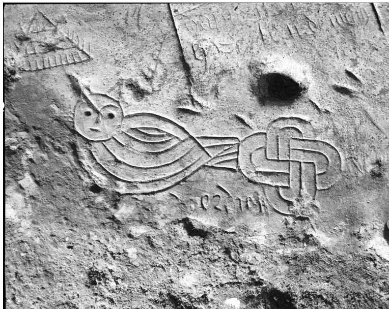
Chouette et noeud de Salomon gravés dans le château de Selles