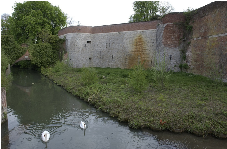
Vue extérieure du château de Selles