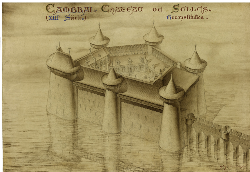
Reconstitution du château de Selles par Nicq-Doutreligne, lavis sur papier