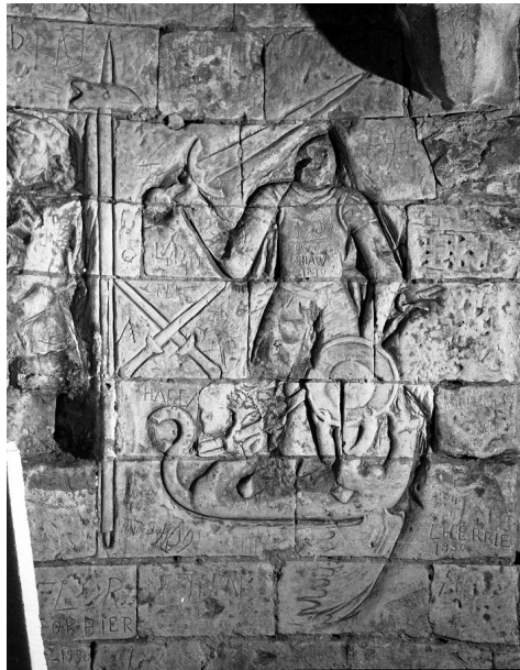
Saint Georges terrassant le dragon, gravé vers 1550 dans le château de Selles