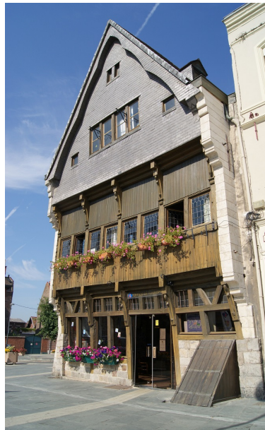
La maison espagnole