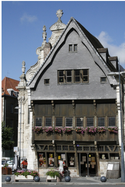
La maison espagnole