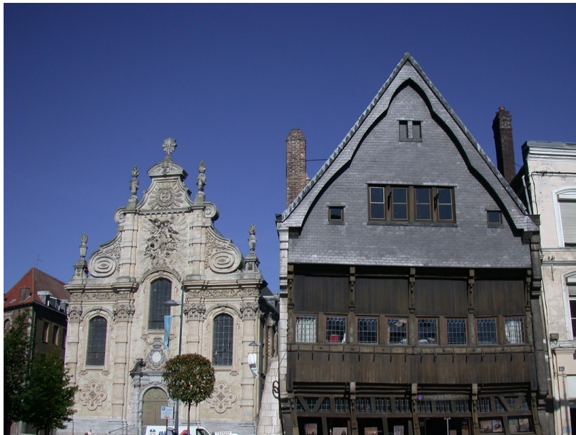
La maison espagnole et la chapelle des jésuites

La maison espagnole de Cambrai doit son nom à l'époque de sa construction, le 16e siècle, alors que la ville est sous domination politique du royaume d'Espagne.