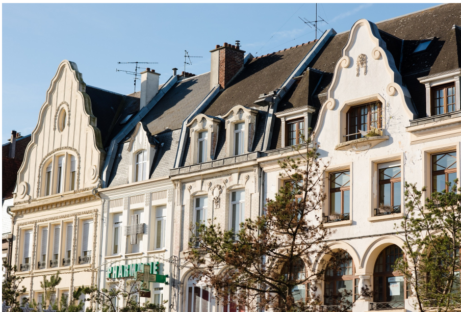
Maisons et commerces de la grand-place © François Moreau