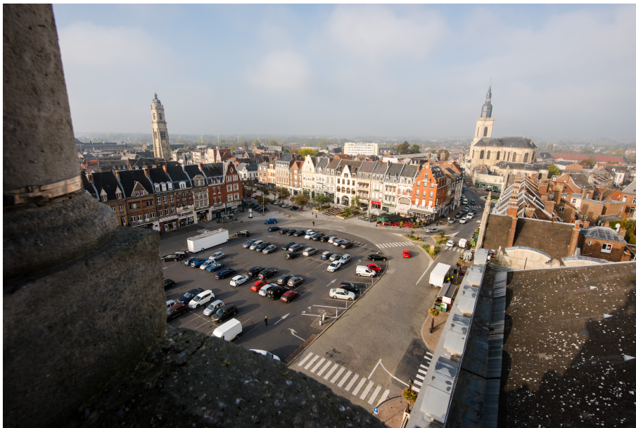
La grand-place depuis le campanile de l'hôtel de ville

La plus vaste place de Cambrai concentre une double vocation, lieu d'exercice des fonctions communales et centre d'activités commerciales. Elle est le point de passage incontournable des Cambrésiens et constitue un trait d'union entre le passé et le 20 e siècle.