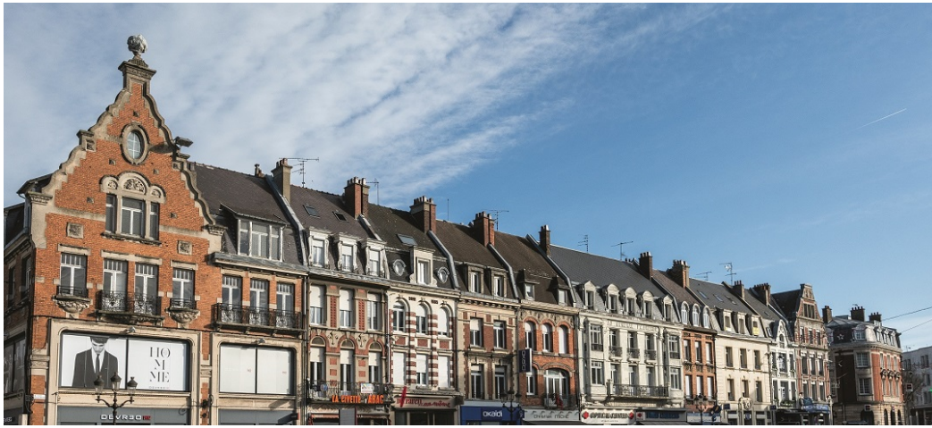
Rang de maisons et commerces de la grand-place