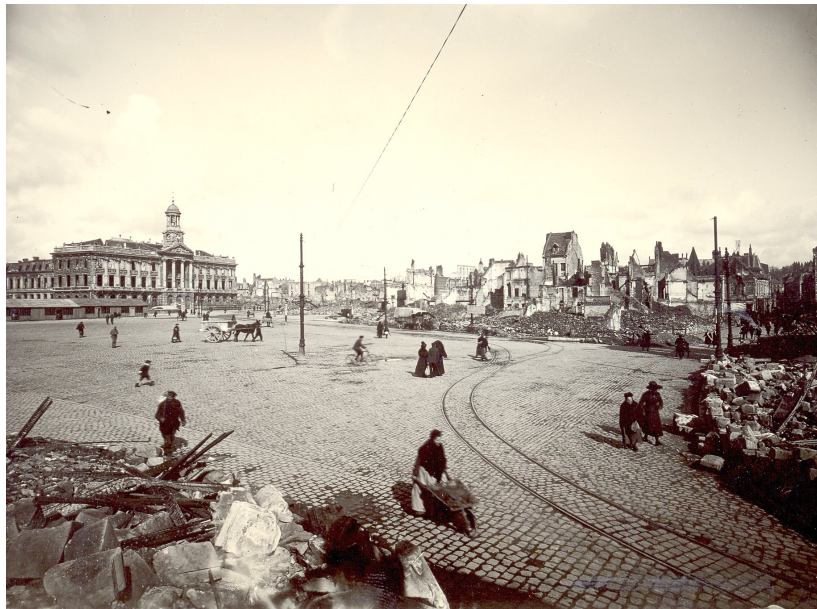
La grand-place après la Première Guerre mondiale