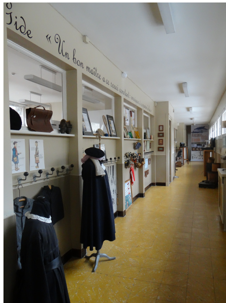
Couloir le long des classes de l'Ecole-Musée de Boulogne-sur-Mer Ecole- Musée - service Ville d'Art et d'Histoire de Boulogne-sur-Mer