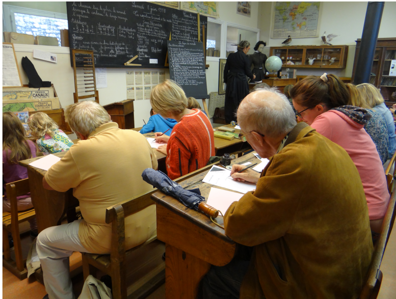
Dictée à la plume de l'Ecole-Musée de Boulogne-sur-Mer Ecole-Musée - service Ville d'Art et d'Histoire de Boulogne-sur-Mer