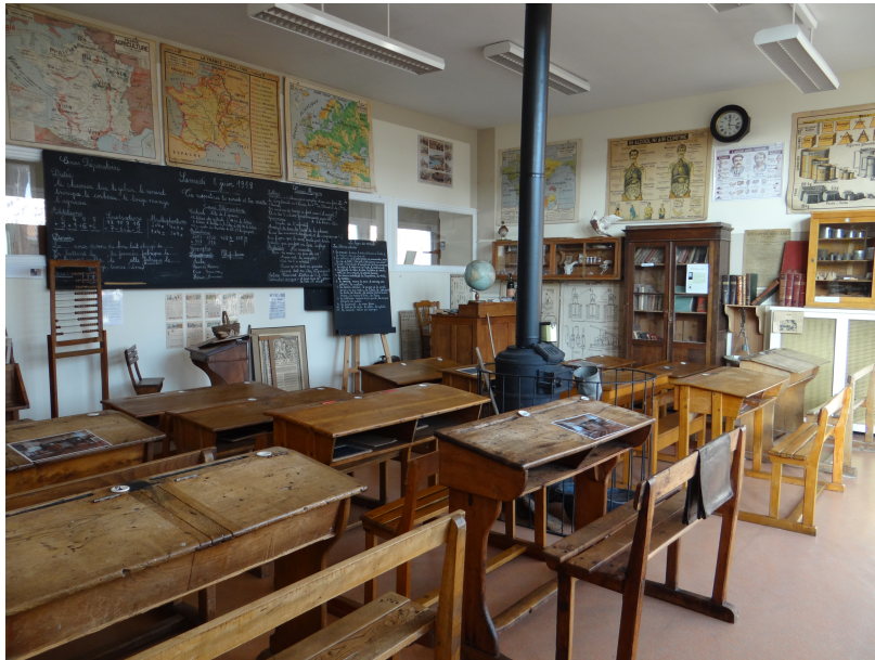
La salle de classe Jules Ferry de l'Ecole-Musée de Boulogne-sur-Mer Ecole-Musée - service Ville d'Art et d'Histoire de Boulogne-sur-Mer