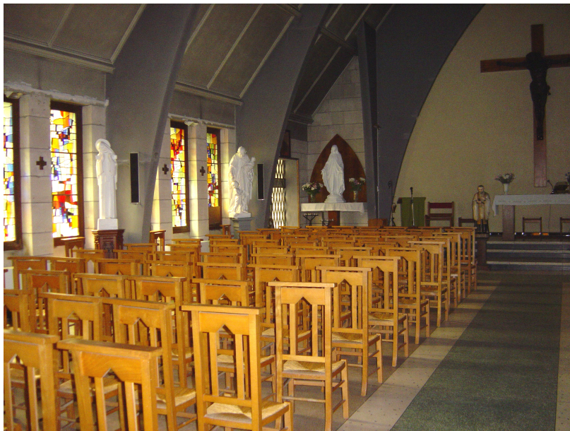
Chapelle de semaine de Saint-Vincent-de-Paul Service Ville d'art et d'histoire, Boulogne-sur-Mer