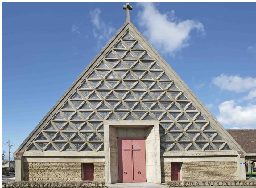
Façade de l'église Saint-Vincent-de-Paul

Héritière d'un premier sanctuaire néogothique, l'église Saint-Vincent-de-Paul illustre les réalisations architecturales remarquables réalisées dans le contexte de la Reconstruction de la ville après la Seconde Guerre mondiale.