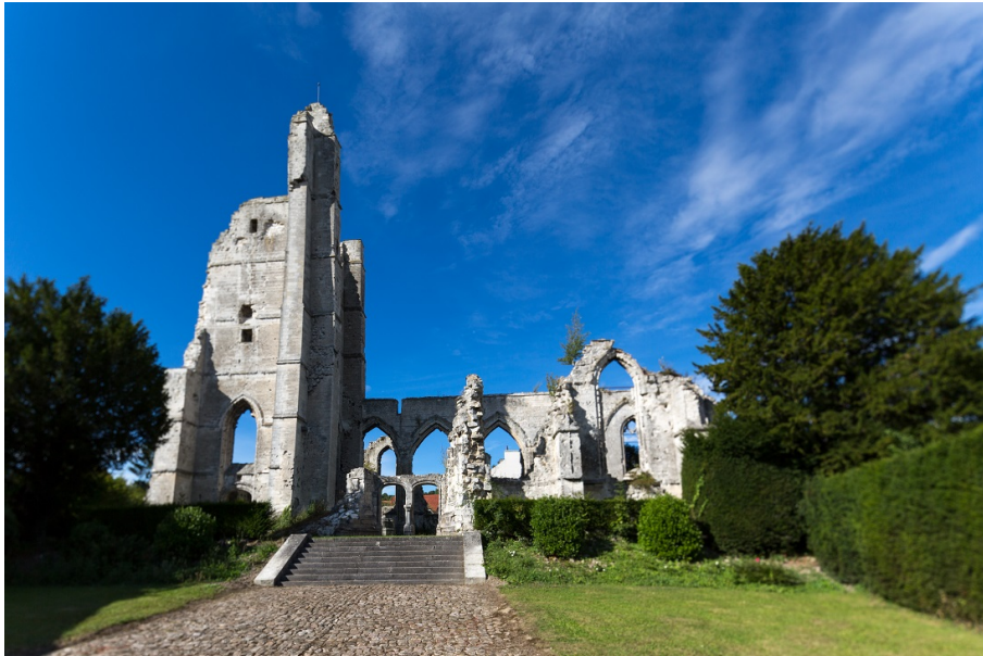
La « Vieille église »