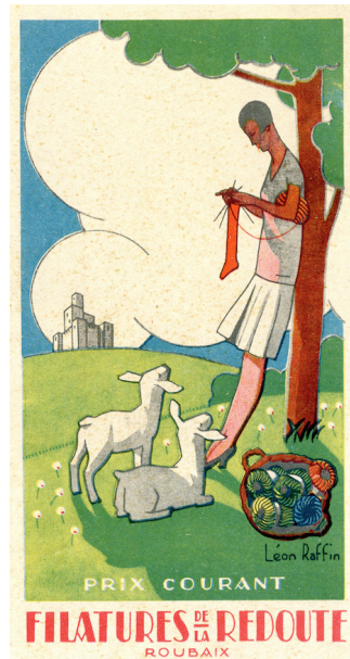
Roubaix La Redoute