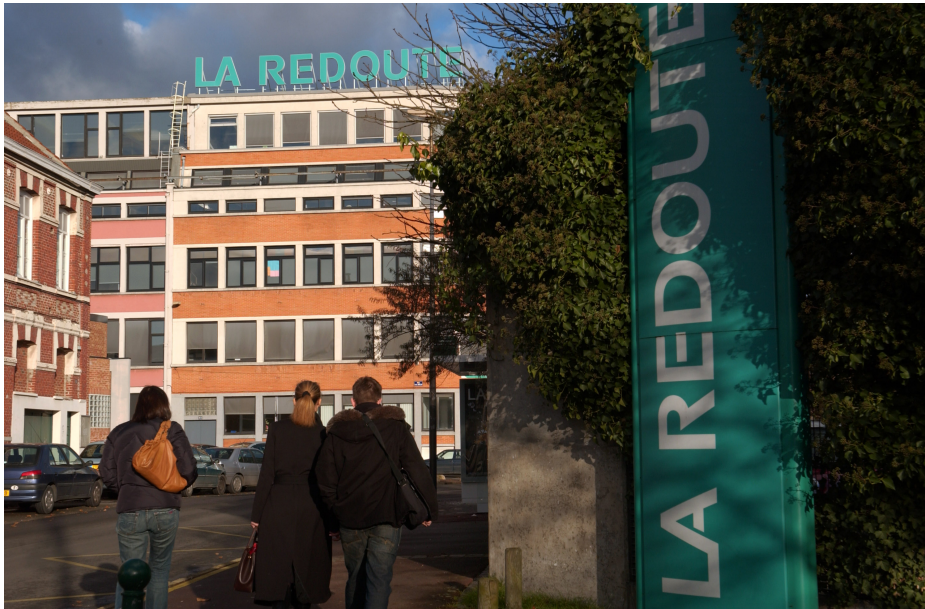
Roubaix La Redoute