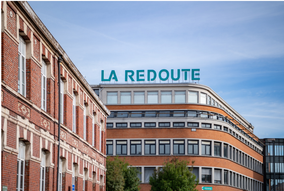
Roubaix La Redoute