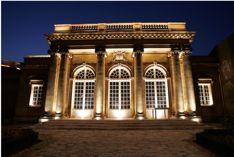
Musée Antoine Lécuyer - Nuit