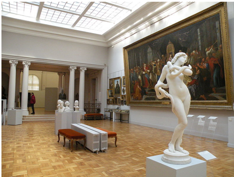
Musée Antoine Lécuyer - Intérieur

En 1877, un banquier saint-quentinois nommé Antoine Lécuyer (1793-1878) décide d'offrir son hôtel particulier à la ville, afin qu'elle puisse exposer et stocker les œuvres de son plus illustre artiste, le portraitiste Maurice Quentin de La Tour (1704-1788).