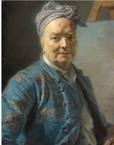
Louis de Sylvestre par Maurice Quentin de la Tour