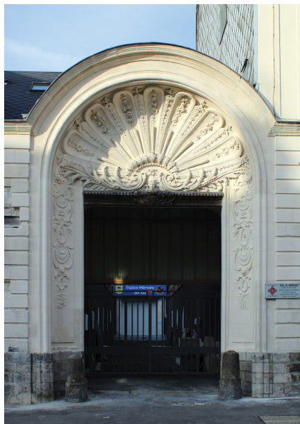
Le portail de l'hôtel de Simencourt

Louis Blériot (1872-1936) est le premier aviateur à traverser la Manche en 1909. Originaire de Cambrai, il a laissé son nom à l'hôtel particulier qui l'a vu naître.