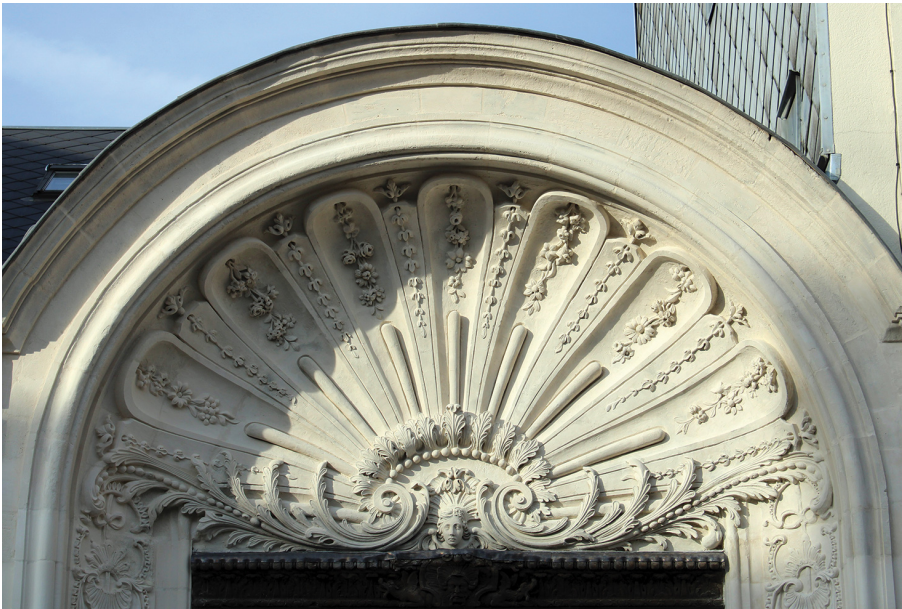
Détail du portail de l'hôtel de Simencourt