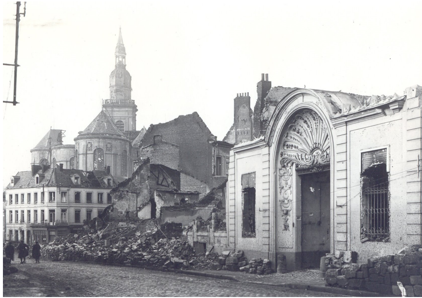
L'hôtel de Simencourt en ruine après la Première Guerre mondiale