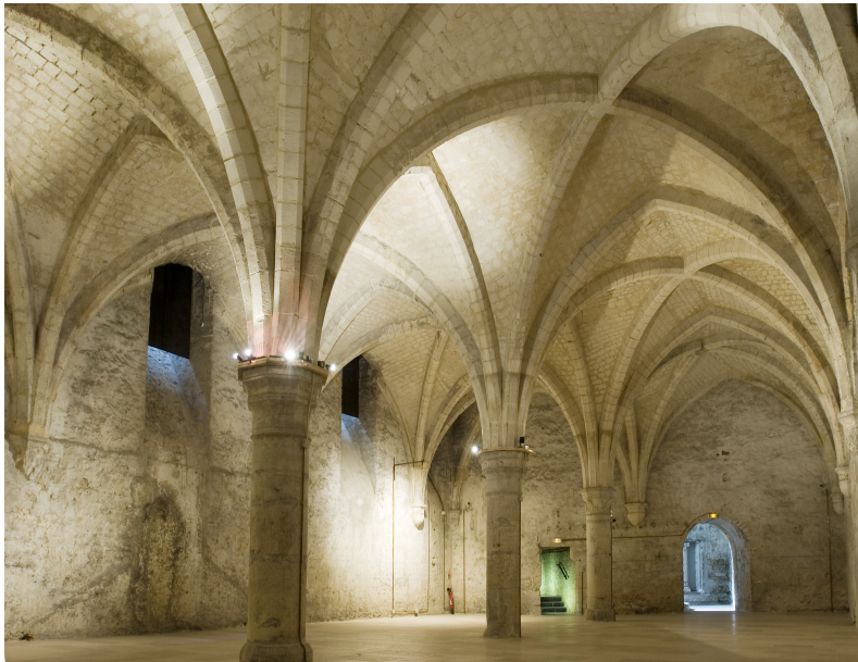
Salle de la barbière