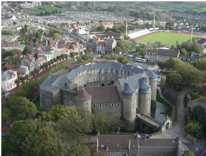
Vue aérienne du château comtal

Le château comtal de Boulogne-sur-Mer prend place à un angle des fortifications qui entourent la haute ville. Construit au 13e siècle, il est un exemple caractéristique des châteaux de l'époque, même s'il a été plusieurs fois remanié. Avec les traces romaines qu'il conserve dans ses sous-sols, il témoigne aussi de l'histoire antique de Boulogne.