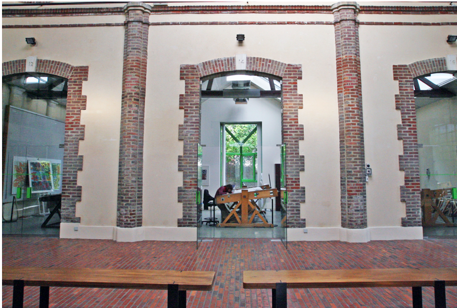
Ateliers installés dans les anciennes loges des abattoirs municipaux