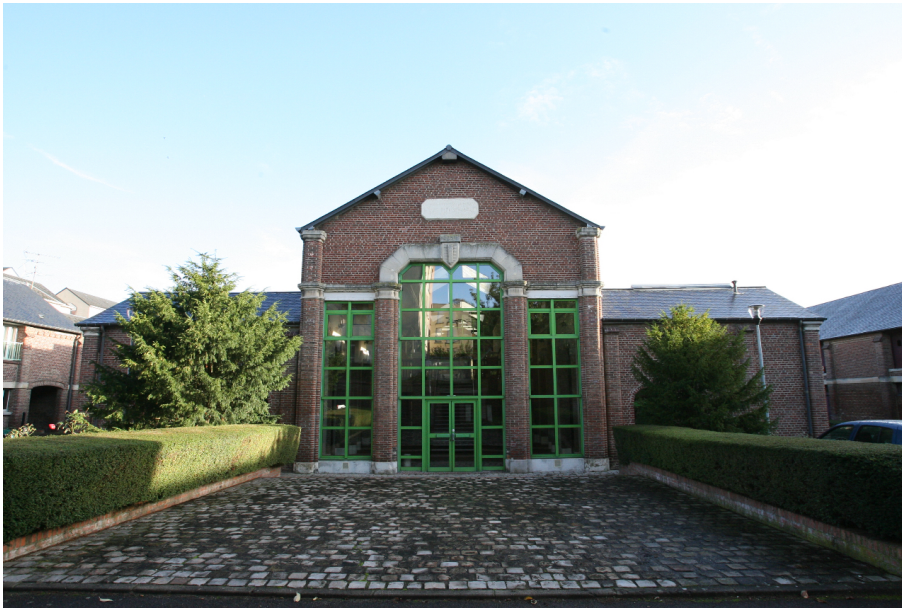
Les anciens abattoirs municipaux qui accueillent la Manufacture nationale de tapisserie depuis 1989