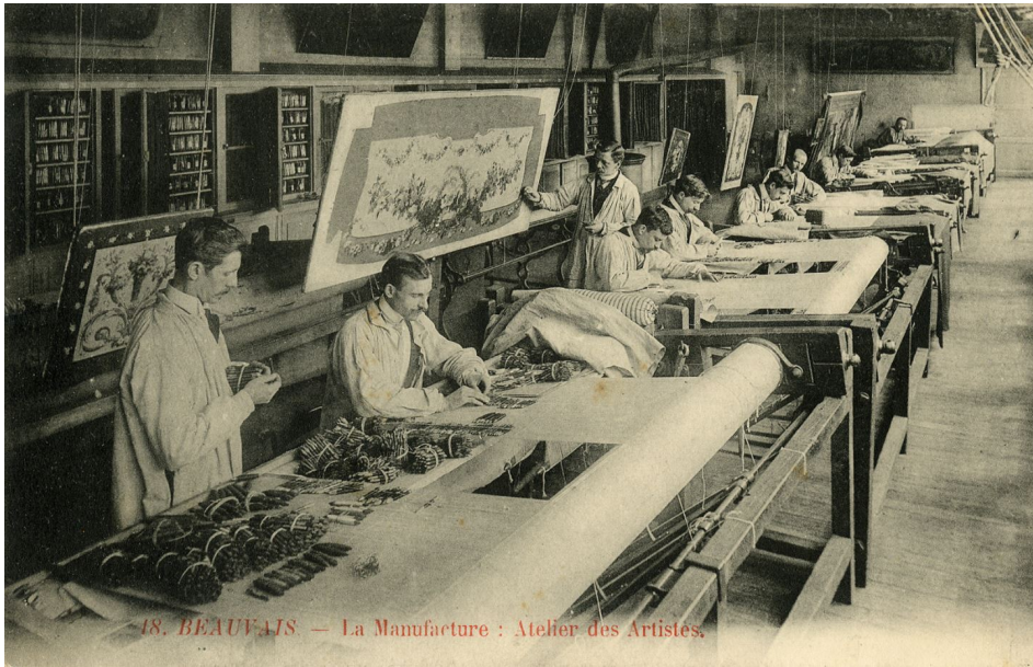
Atelier des lissiers au 19e siècle