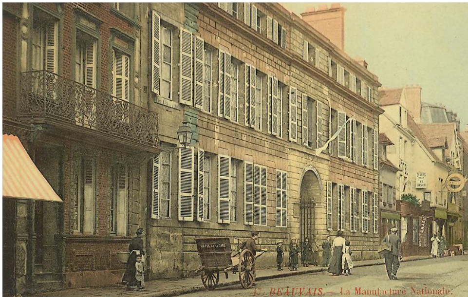
Façade de la Manufacture nationale de tapisserie au 19e siècle