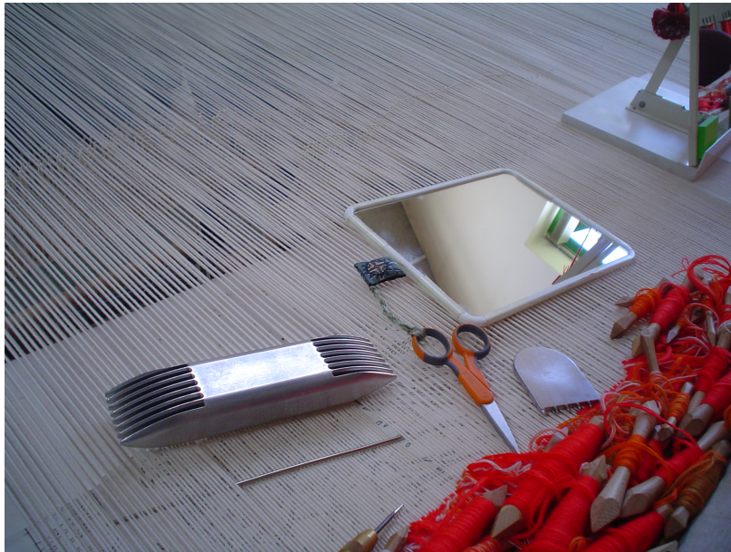
Les outils du lissier