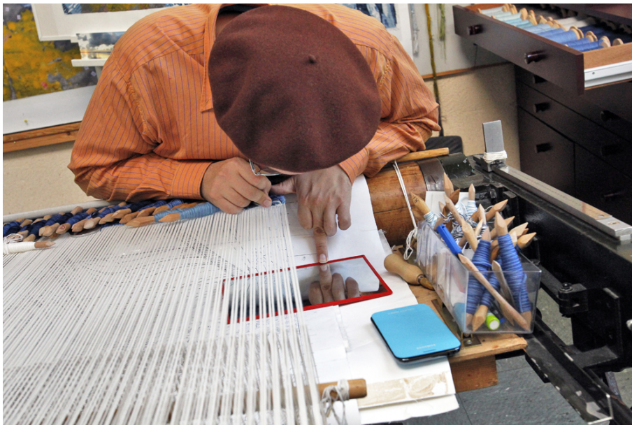
Lissier au travail