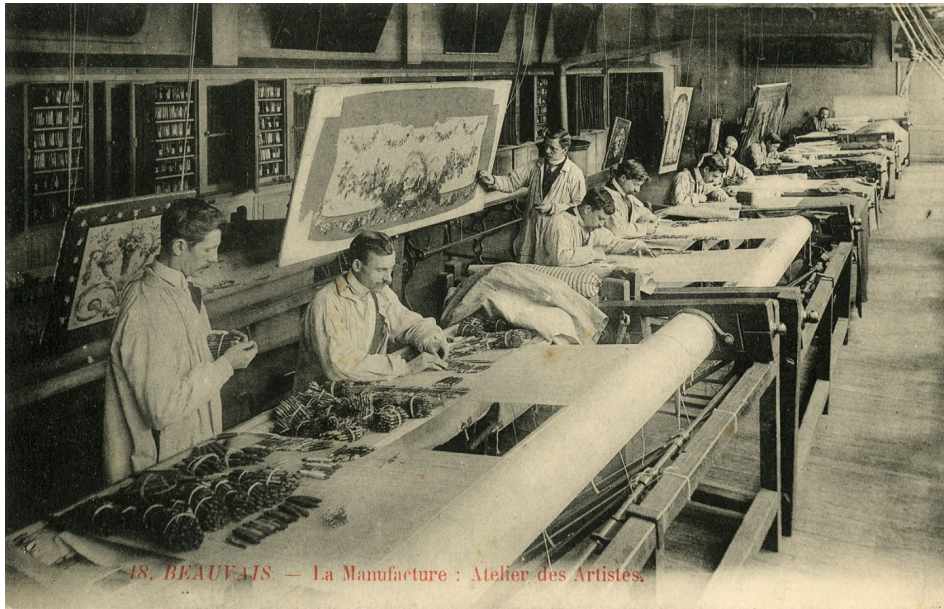
Atelier des lissiers au 19e siècle