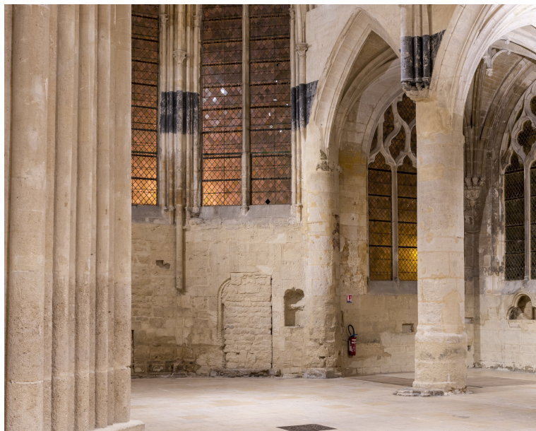
Ancienne église Saint-Pierre, coté chœur, après restauration complète de l'édifice (2009-2017)