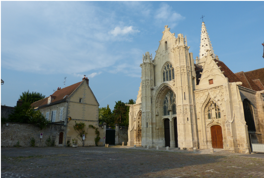
Ancienne église Saint-pierre, vue sur la façade flamboyante remaniée au 16ème siècle depuis la place Saint-Pierre