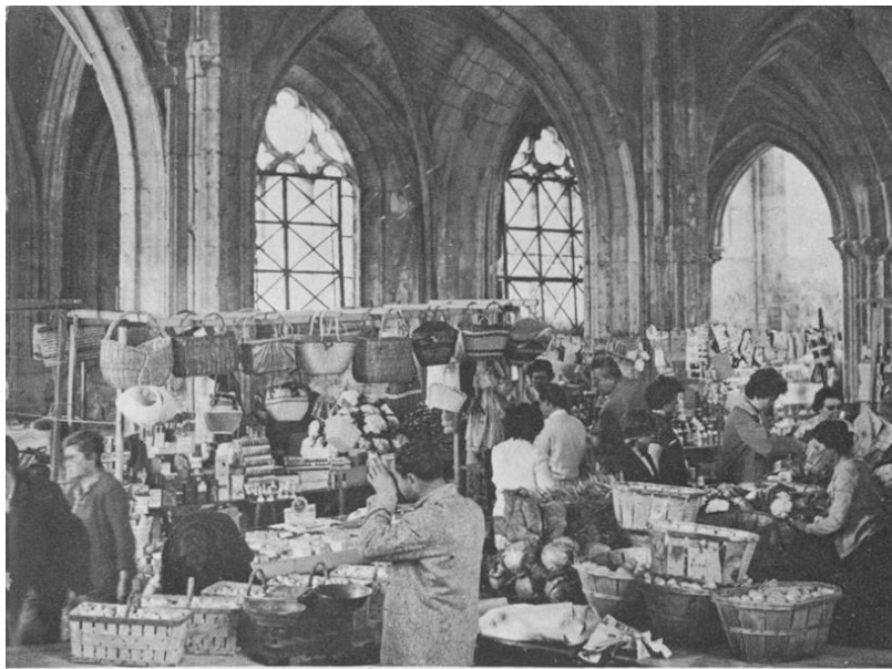
Ancienne église Saint-Pierre, vue intérieur marché couvert de la ville, situé au sein de l'ancienne Eglise Saint-Pierre de 1881 à 1974, coté nef