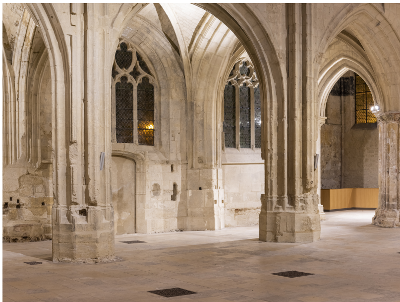
Ancienne église Saint-Pierre, coté nef, après restauration complète de l'édifice (2009-2017)