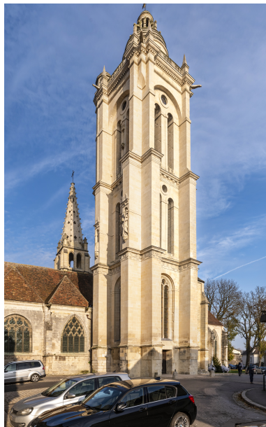
Ancienne église Saint-Pierre, perspective sur le campanile du 16ème siècle, après restauration complète de l'édifice (2009-2017)