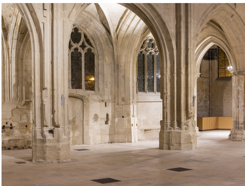
Ancienne église Saint-Pierre, coté nef, après restauration complète de l'édifice (2009-2017)