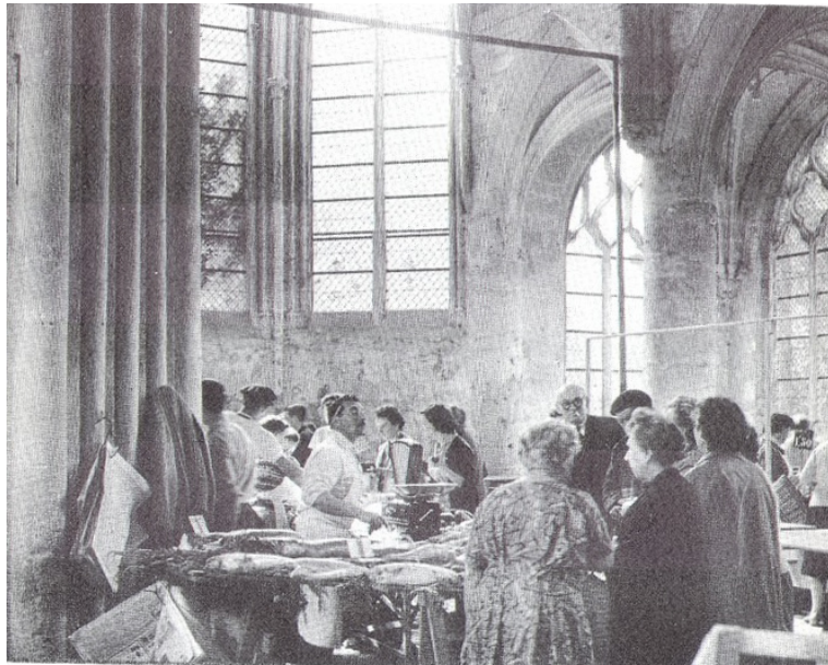
Ancienne église Saint-Pierre, marché couvert de la ville, situé au sein de l'ancienne Eglise Saint-Pierre de 1881 à 1974, coté chœur