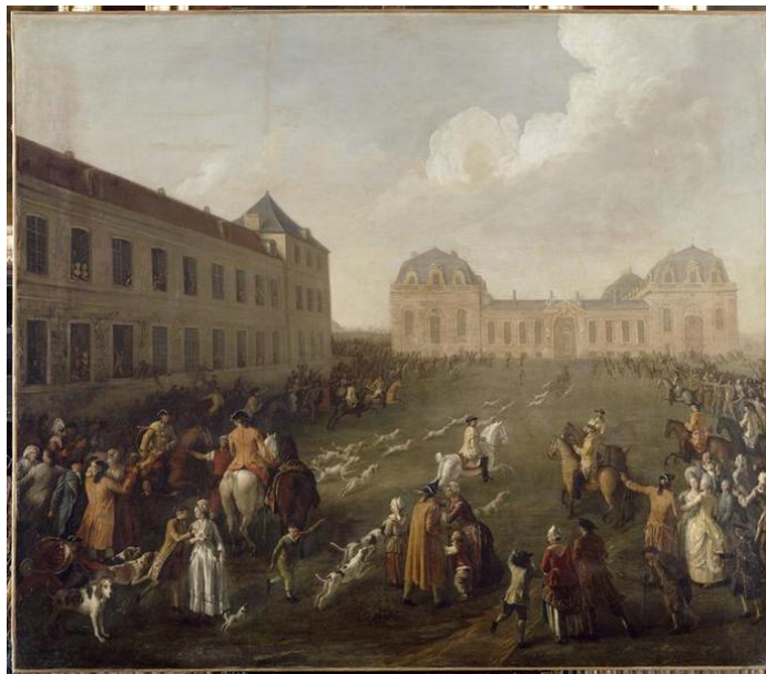
Hallali devant les Grandes Ecuries, Dubois, 18e s.