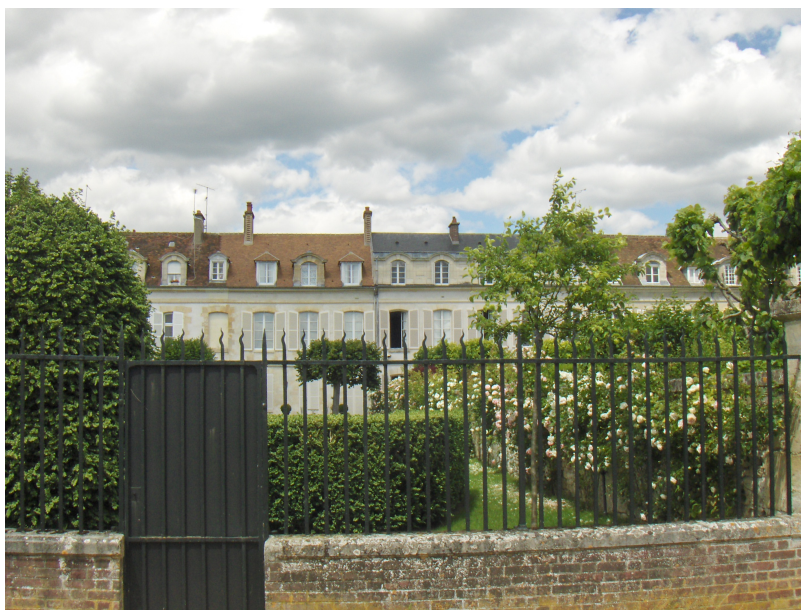
Maisons des officiers