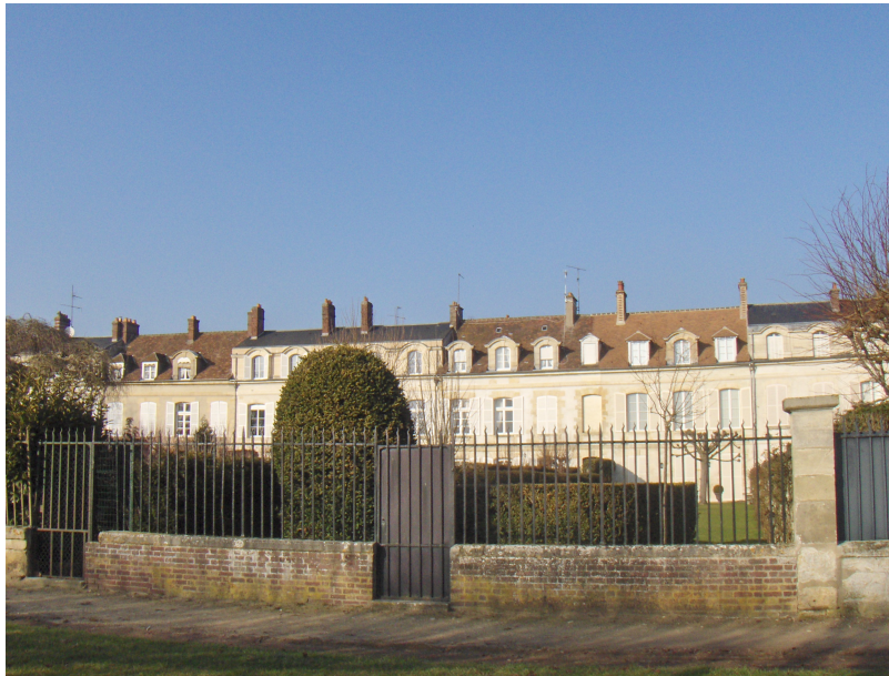
Maisons des officiers