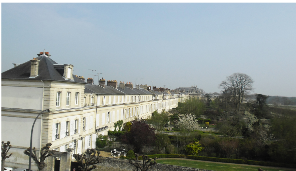
Maisons des officiers