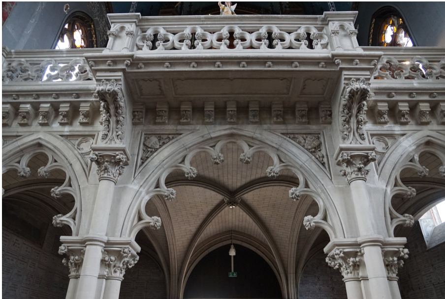
Tribune à l'intérieur de la chapelle Saint-Joseph