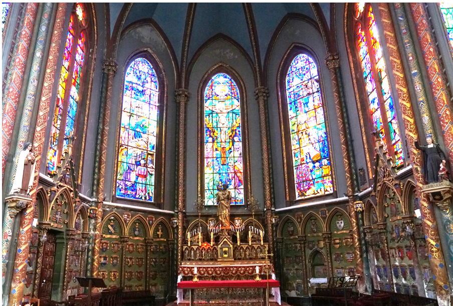
Chœur de la chapelle Saint-Joseph avec les vitraux de Raphaël Lardeur