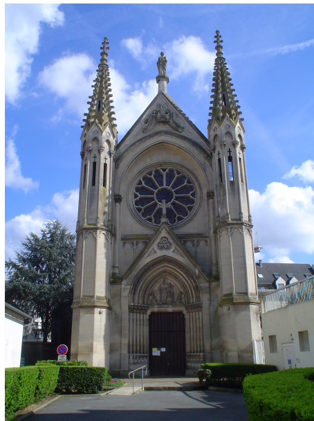
Façade de la chapelle Saint-Joseph