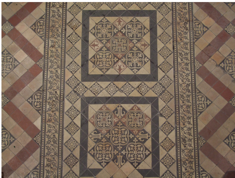
Pavement Boulenger au sol de l'église Saint-Jacques