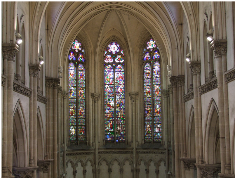
Intérieur de l'église Saint-Jacques