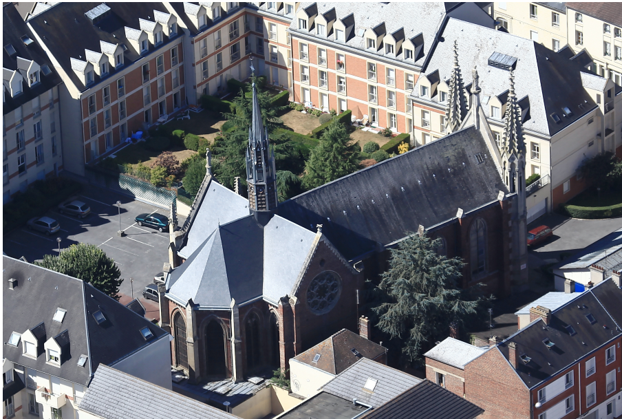
Vue aérienne de la chapelle Saint-Joseph