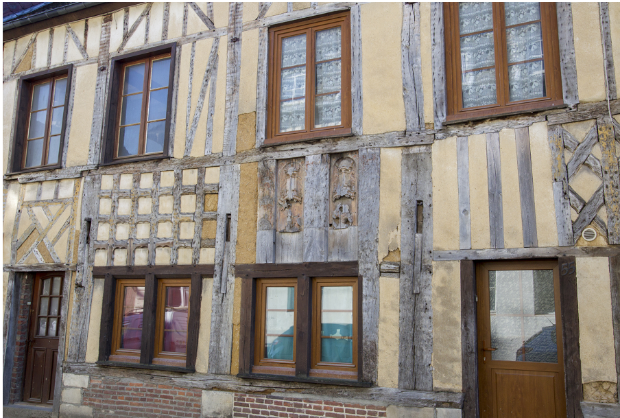
Maison ancienne de la rue Saint-Just-des-Marais