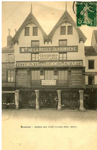
La maison dite des Trois Piliers sur la place Jeanne-Hachette, classée Monument historique en 1889, détruite en 1940