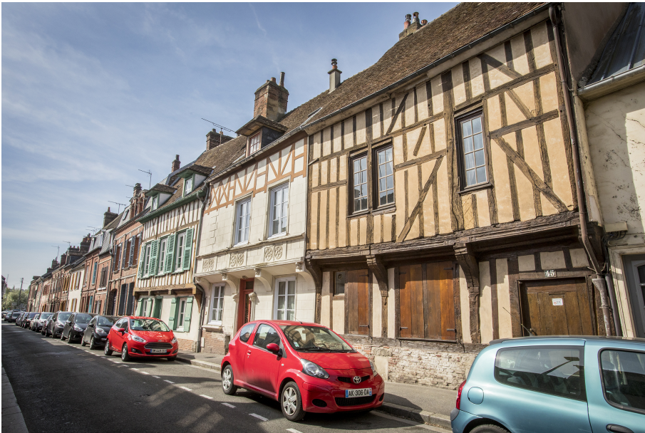
La rue de la préfecture