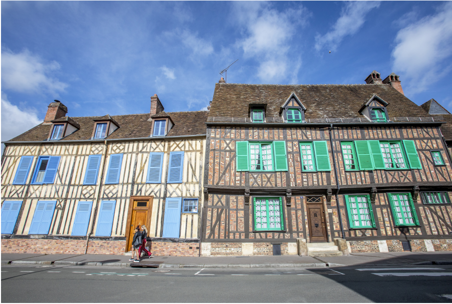
La rue de la Banque