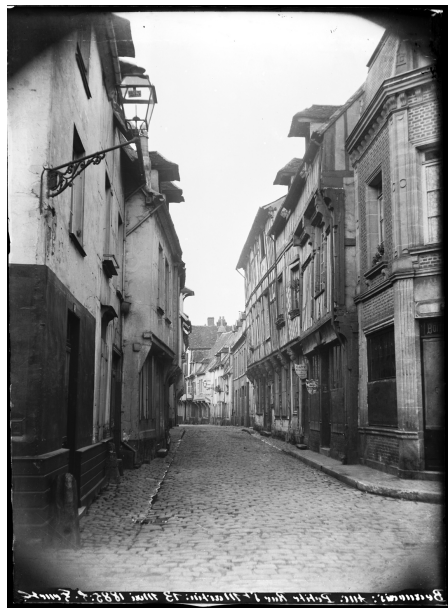
Ancienne rue Saint-Martin de Beauvais. Photographie prise par Léon Fenet le 13 mai 1885 © Collection de la Ville de Beauvais, dépôt aux Archives départementales de l'Oise (EDT 294/S1)

Jusqu'à la Seconde Guerre mondiale, Beauvais a l'image d'une cité médiévale aux rues étroites bordées de maisons à colombages, charme pittoresque apprécié des voyageurs en villégiature. Si 80% du centre-ville actuel a brûlé suite au bombardement de l'aviation allemande en juin 1940, la ville conserve encore quelques rues bordées de maisons à pans de bois et torchis.