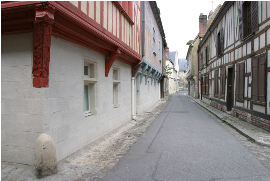
Rue de l'École du Chant