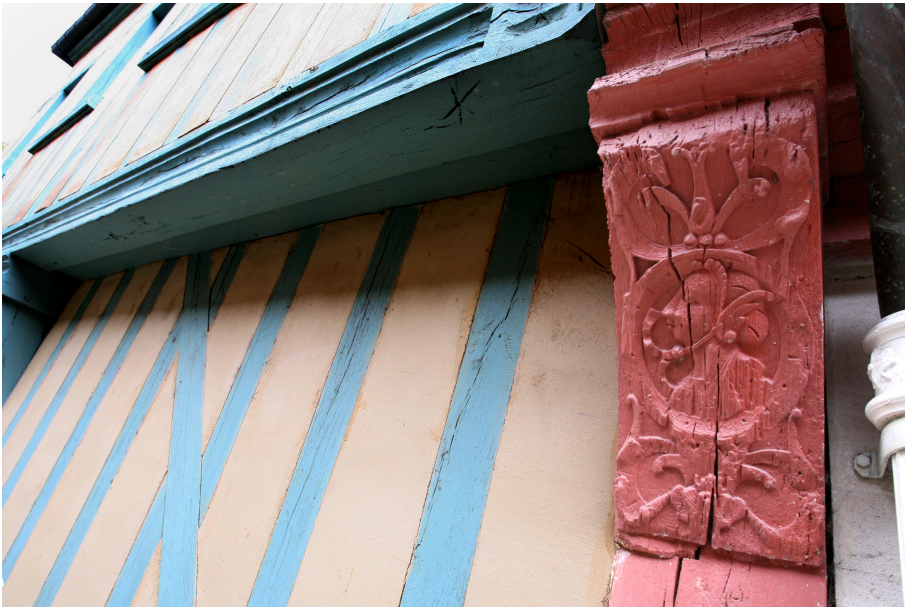
Détail de la Maison Rodin