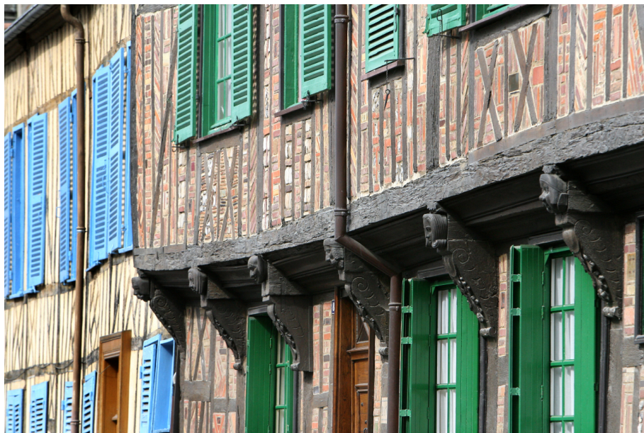
La rue de la Banque