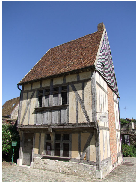
Maison du 15e siècle remontée au chevet de la cathédrale par l'association Maisons Paysannes de l'Oise

Pans de bois et torchis, une architecture ancestrale du Beauvaisis