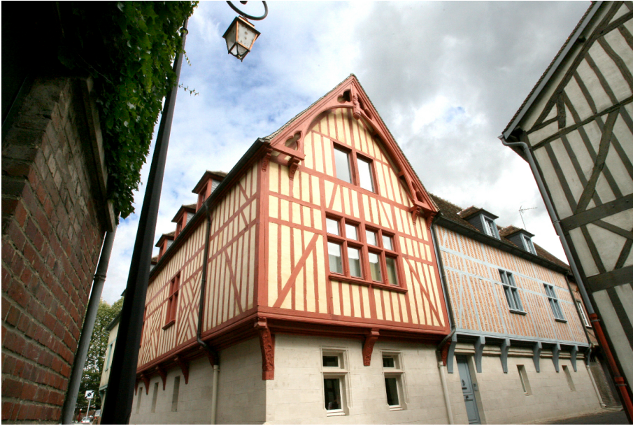
La maison Rodin, au croisement de la rue du Tourne-Broche et de la rue de l'École de Chant, inscrite au titre des Monuments historiques en 1996