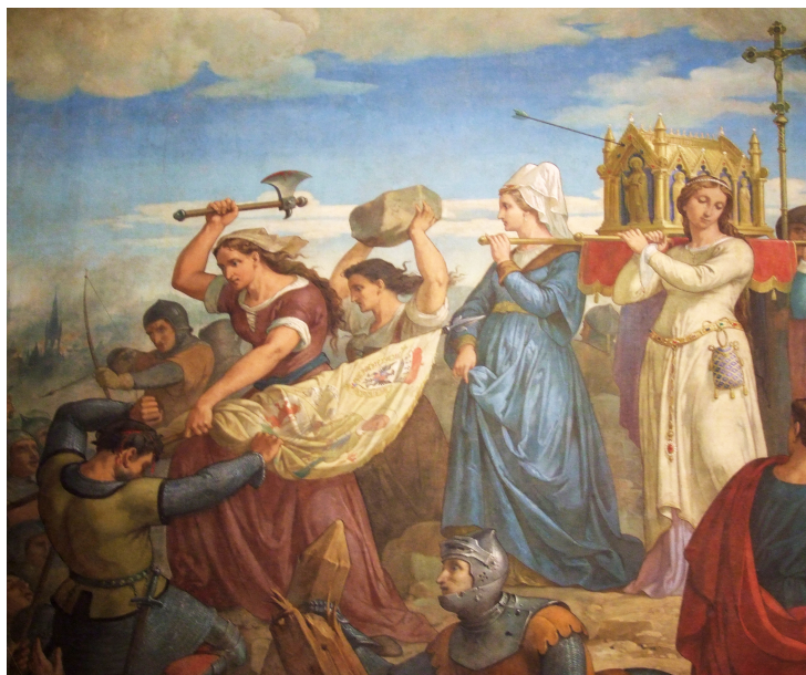
Peinture d'Alexandre Grellet, chapelle Sainte-Angadrême de la cathédrale Saint-Pierre, 1869 © Ville d'art et d'histoire, Ville de Beauvais