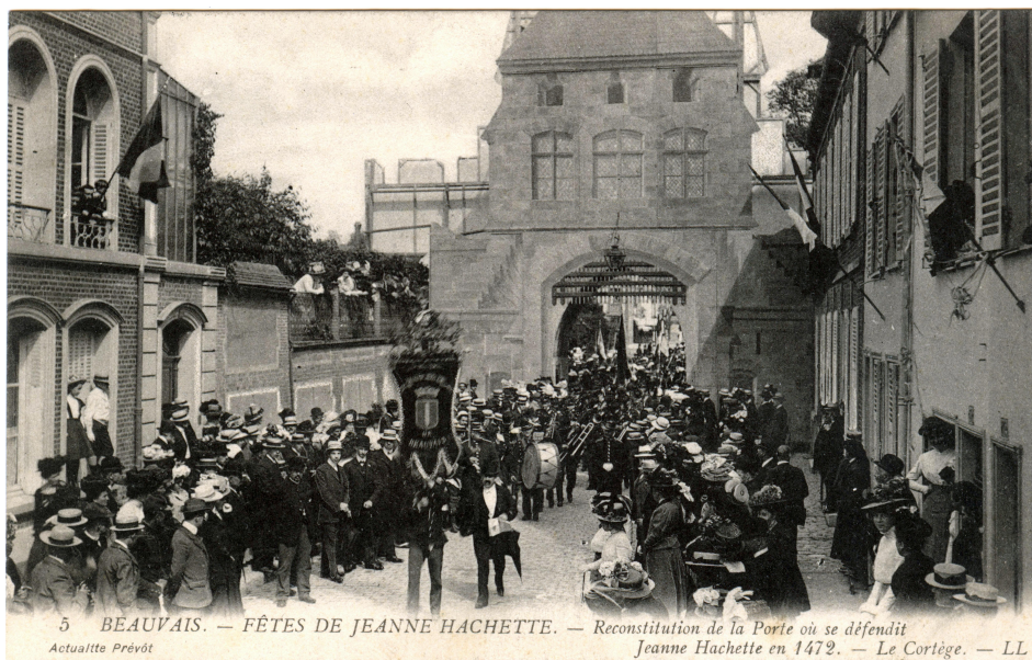
Reconstitution de la porte de Bresles à l'occasion des Fêtes Jeanne-Hachette