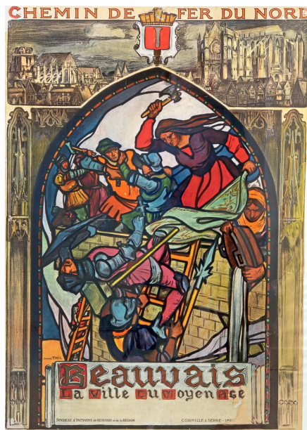
Affiche des chemins de fer du Nord