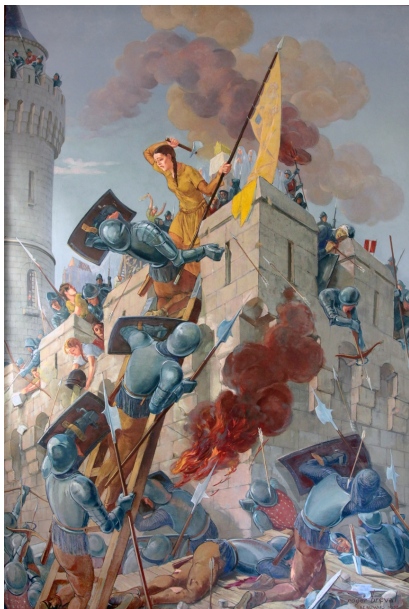
Jeanne Hachette aux créneaux, peinture de Roger Bréval, 1953