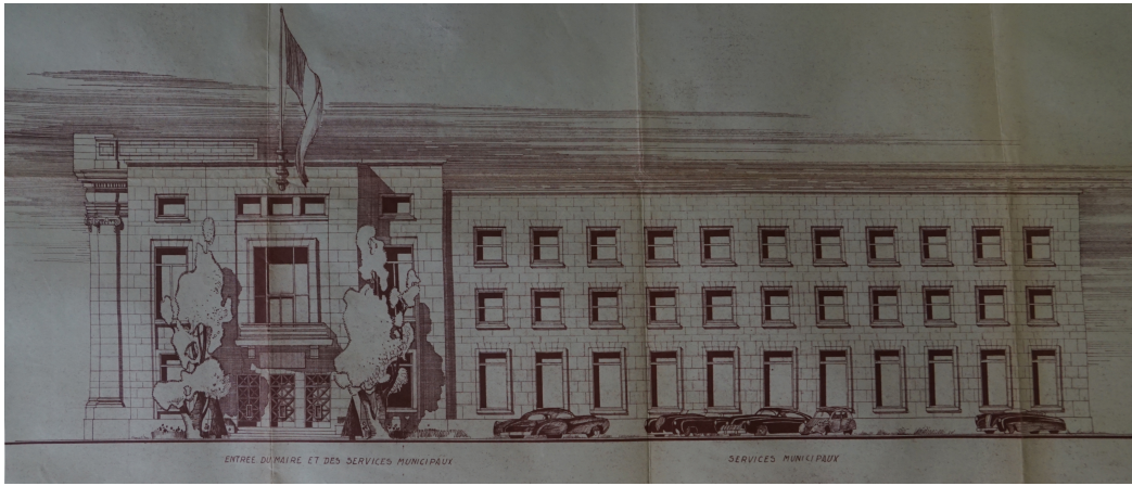
Projet de façade du nouvel hôtel de ville dessiné par Georges Noël, octobre 1950