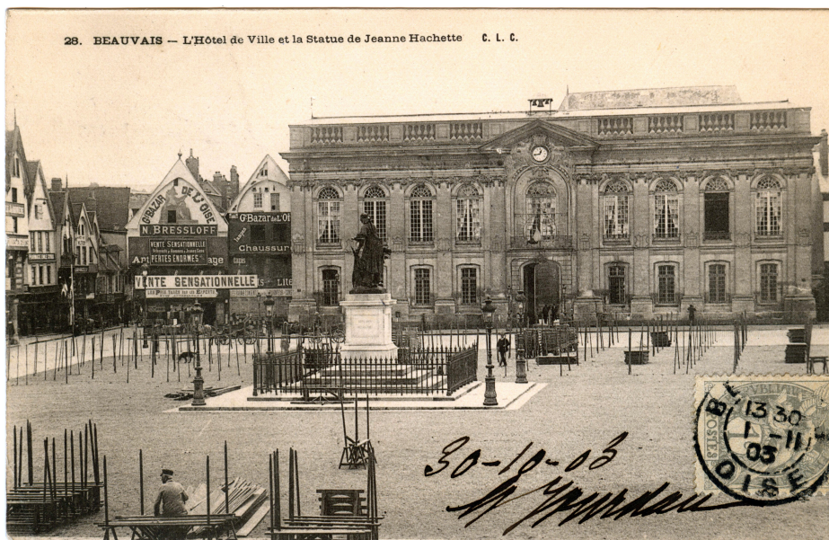
L'hôtel de ville avant 1940