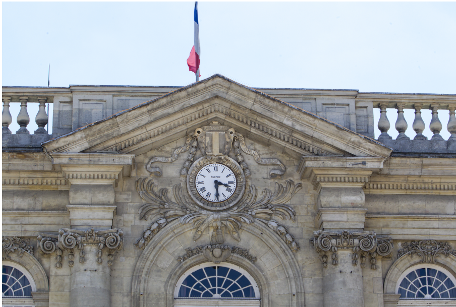
Fronton de l'hôtel de ville. Au-dessus de l'horloge, le blason de Beauvais accompagné de sa devise « palus ut fixus constans et firma manebo » (tel ce pieu fiché, constante et ferme je resterai)