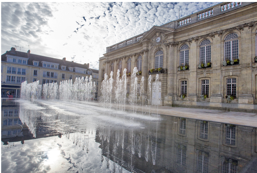
Façade de l'hôtel de ville sur la place Jeanne-Hachette

Très tôt au Moyen Âge, à la fin du 11 e siècle, Beauvais se voit attribuer une charte communale fixant les rapports entre l'évêque-comte et la commune. Dès cette époque, un lieu de rassemblement pour les représentants du pouvoir communal s'installe à proximité de la place du marché, actuelle place Jeanne-Hachette.