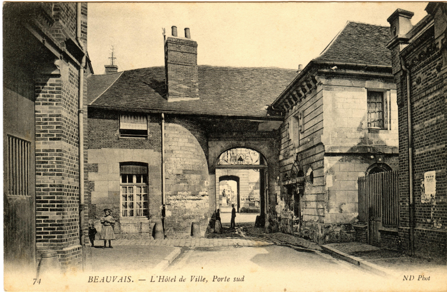
Cour intérieur de l'hôtel de ville avant 1940