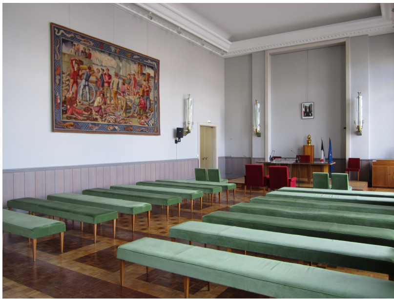
La salle des mariages aujourd'hui. Le mobilier a été réalisé par la Maison Leleu en 1965 et est inscrit au titre des Monuments historiques